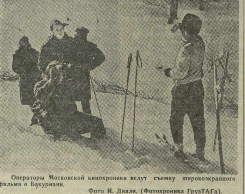
Операторы Московской кинохроники ведут съемку широкоэкранного фильма о Бакуриани.

БАКУРИАНИ, 20. (Спец. корр. «Зара Востока»). После небольшого перерыва в Бакуриани возобновились состязания сильнейших лыжников Советского Союза.