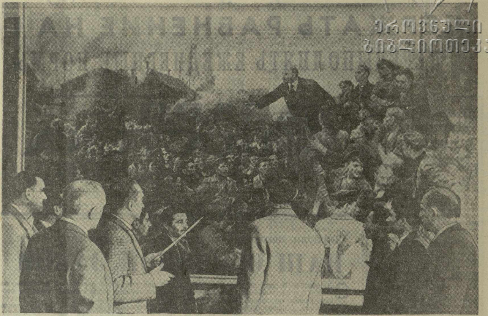
Тбилисский филиал Центрального музея Ленина. На снимке: посетители у картины В. А. Серова «Выступление В. И. Ленина на митинге рабочих Путиловского завода в мае 1917 года».