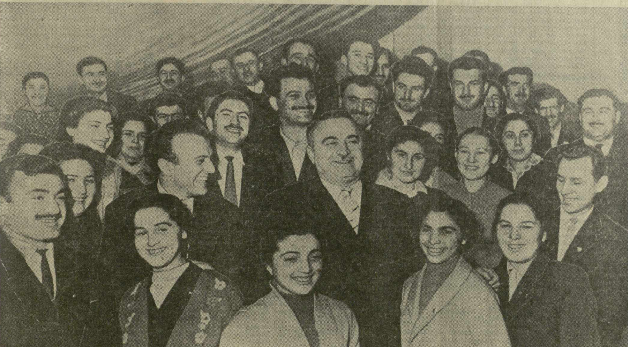
На снимке: кандидат в члены Президиума ЦК КПСС, первый секретарь ЦК КП Грузии В. П. Мжаванадзе среди делегатов XXIII съезда ЛКСМ Грузии.