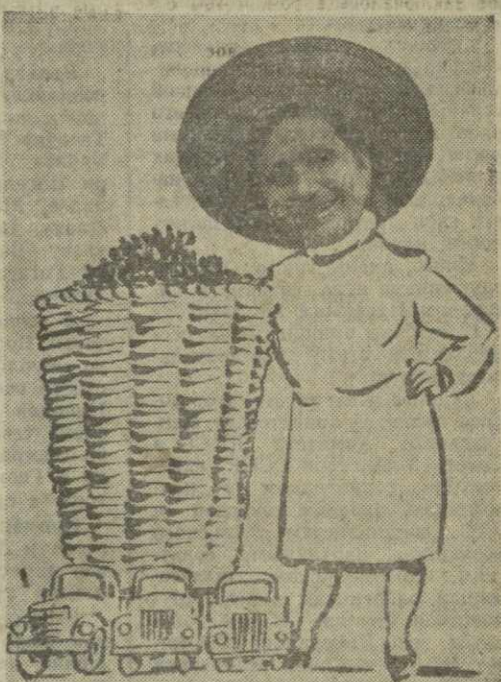
Царица солнечной долины, Не ней поет зеленый чай. Не увезешь на трех машинах Большой Татьянин урожай. Дружеские шаржи А. Канделак. Стихи В. Панова.