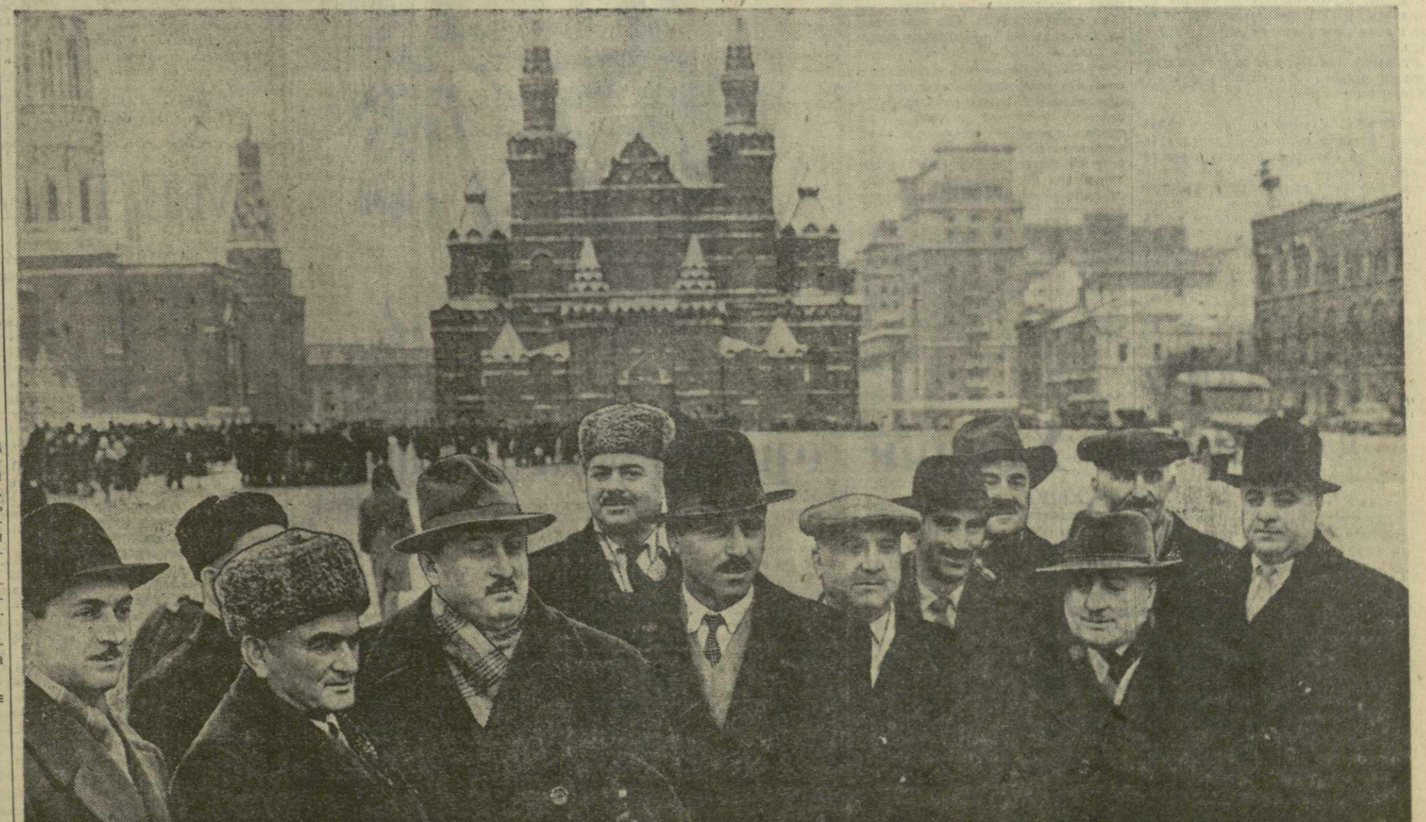
На снимке: группа участников Пленума ЦК КПСС, прибывших вчера из Грузии, на Красной площади в Москве.