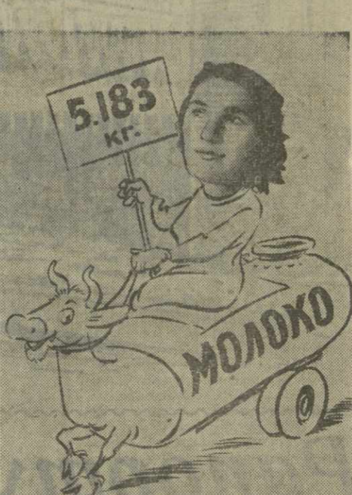
У Додо побед больше не мало, У нее волшебная рука И ее «коньком» корова стала С полною цистерной молока.