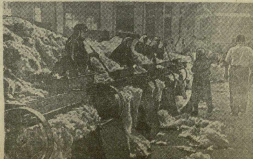
Турция. Тяжел труд рабочих на хлопкоочистительных фабриках в Турции. На снимке: на одной из хлопкоочистительных фабрик.

И это, пожалуй, самая характерная картинка современной Турции.