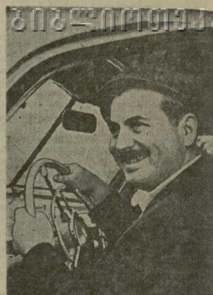
В армии Папуна Николаевича сидел за рулем грузовика артиллерийского полка. Уволившись в запас, он сел за баранку такси.

Л. ПИРАДОВ, С. ХЕЛАДЗЕ. (Корр. «Заря Востока»).