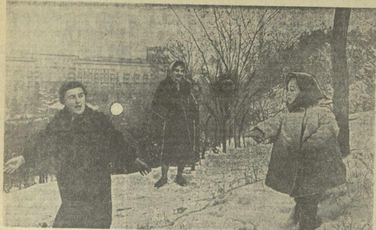
Слова снег в Тбилиси.