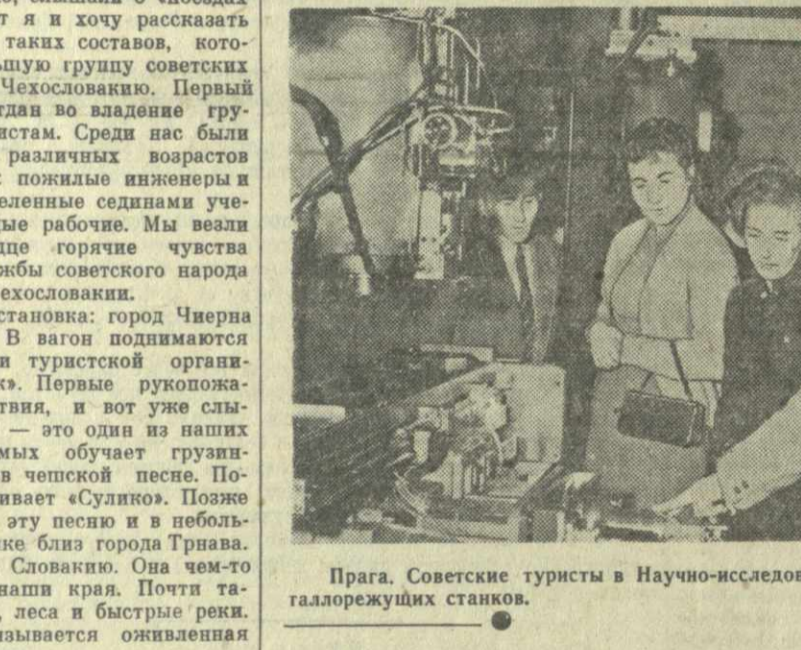
Прага. Советские туристы в Научно-исследовательском институте металлорежущих станков.

...Первая остановка: город Черна над Тисой. В вагон поднимаются представители туристской организации «Челок». Первые рукопожатия, приветствия, и вот уже слышится пенне — это один из наших новых знакомых обучает грузинских туристов чешской песне. Потом он затягивает «Сулпо». Позже мы слышали эту песню и в небольшой деревушке близ города Трнава.