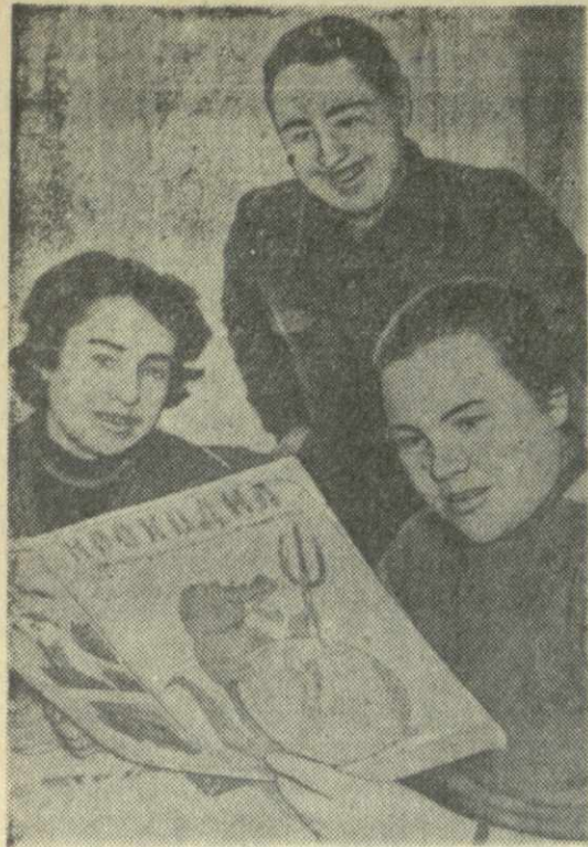
На снимке: в ночном санатории Тбилисской обувной фабрики № 1 в часы досуга.