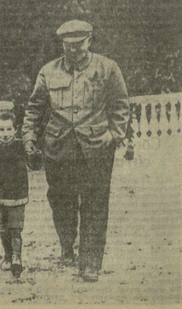
В. И. Ленин с племянником Виктором в Горках. 1922 г.