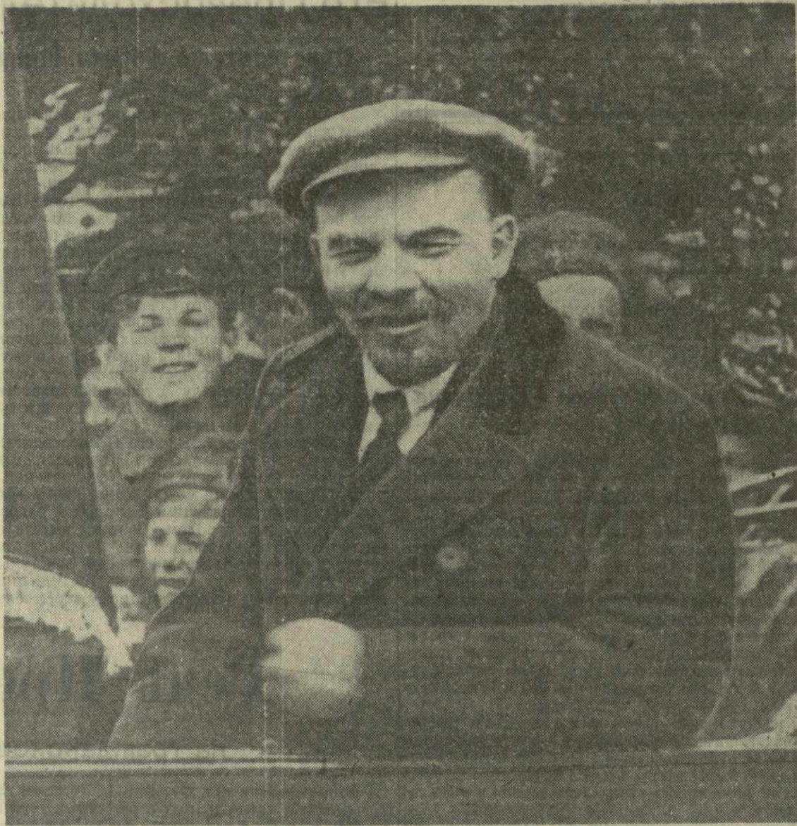
В. И. Ленин у рабочих Рублевской водокачки (1919 г.)

В публикуемых ниже отрывках из воспоминаний друзей и соратников товарища Ленина Владимир Ильич показан в различной обстановке. Великий вождь революции перед нами предстает как предельно скромный человек, не терпящий никаких восхвалений в свой адрес, заботливый друг, сердечный товарищ.