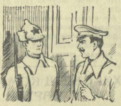
Команданту дал приказ: никого не допускать...