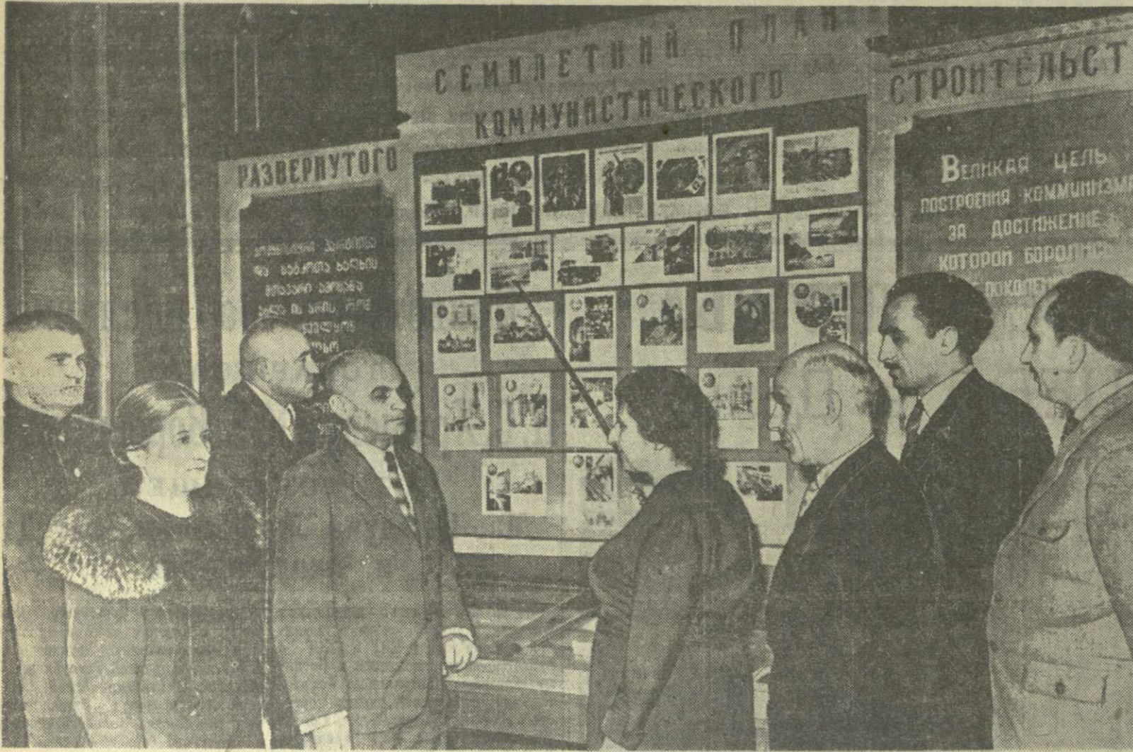
На снимке: пропагандисты района имени 26 комиссаров гор. Тбилиси у стенда, посвященного семилетнему плану развития народного хозяйства СССР.