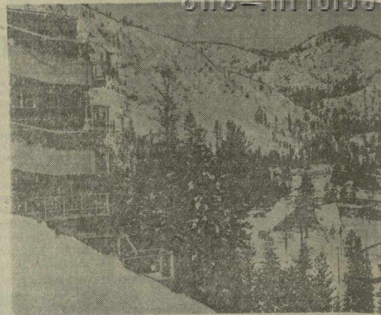
К предстоящим зимним Олимпийским играм в Скво Вэлли (США). На снимке: вид с трамплина.