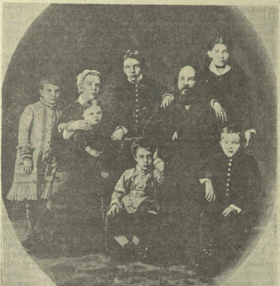
Семья Ульяновых в Симбирске.

Вне тюрьмы оказалась лишь мать Владимира Ильича — Мария Александровна. Это была женщина исключительно душевной красоты и благородства.