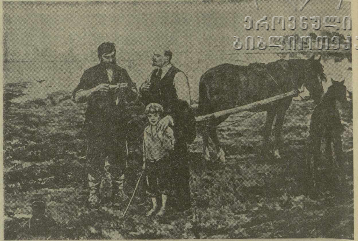
«Разговор о земле».