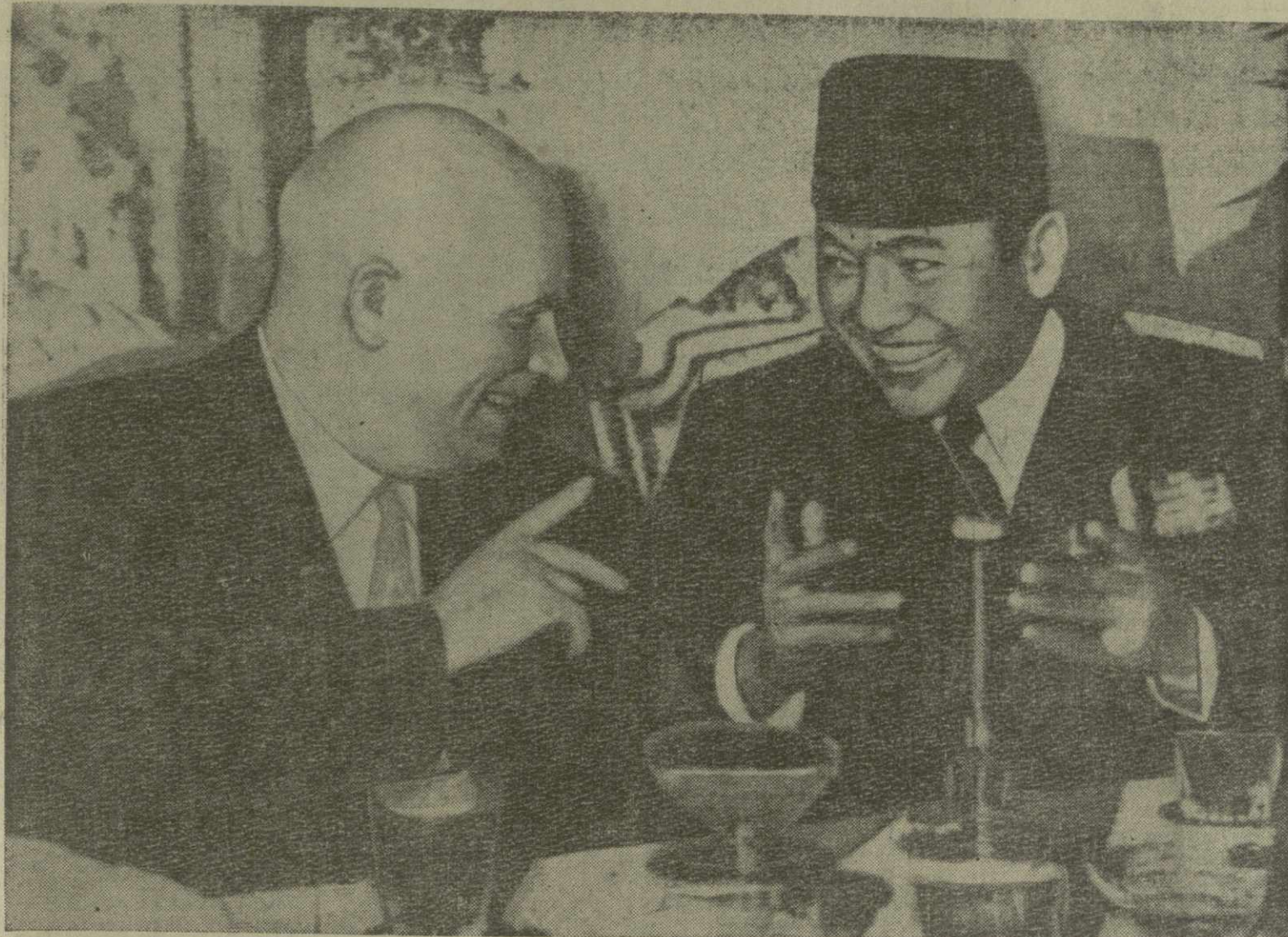
Председатель Совета Министров СССР Н. С. Хрущев и Президент Республики Индонезии Сукарно во дворце Мердека.