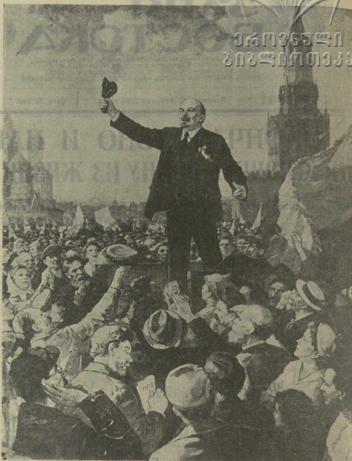
Выступление В. И. Ленина на Красной площади, май 1919 года.

Н. С. Хрущев и Президент Сукарно, провожаемые громом оваций, восторженными возгласами «мир» и «дружба», покидают университет и направляются в свою резиденцию. Вечером Н. С. Хрущев и Президент Сукарно присутствовали на концерте индонезийской музыки и танца.