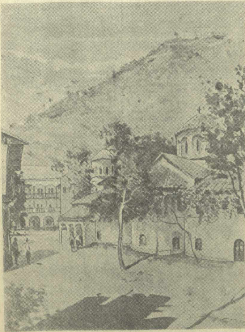
На нашем снимке — картина художника Р. Рускади Джайришвили, которую она написала, будучи в Болгарии. Художница запечатлела на полотне широко известный Болковский монастырь, распался в 1902 году в результате землетрясения. В посвященном монастырю историческом очерке, выпущенном в Болгарии, приводятся интересные данные об этом замечательном памятнике древней культуры.

Бачковский монастырь, рассказывается в очерке, был основан