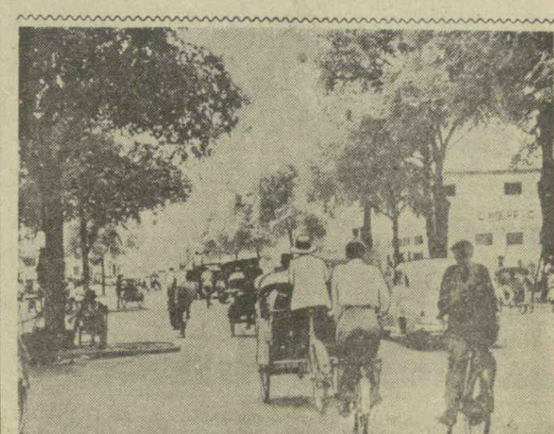
Индонезийская Республика. На улице города Джокьякарты (остров Ява).