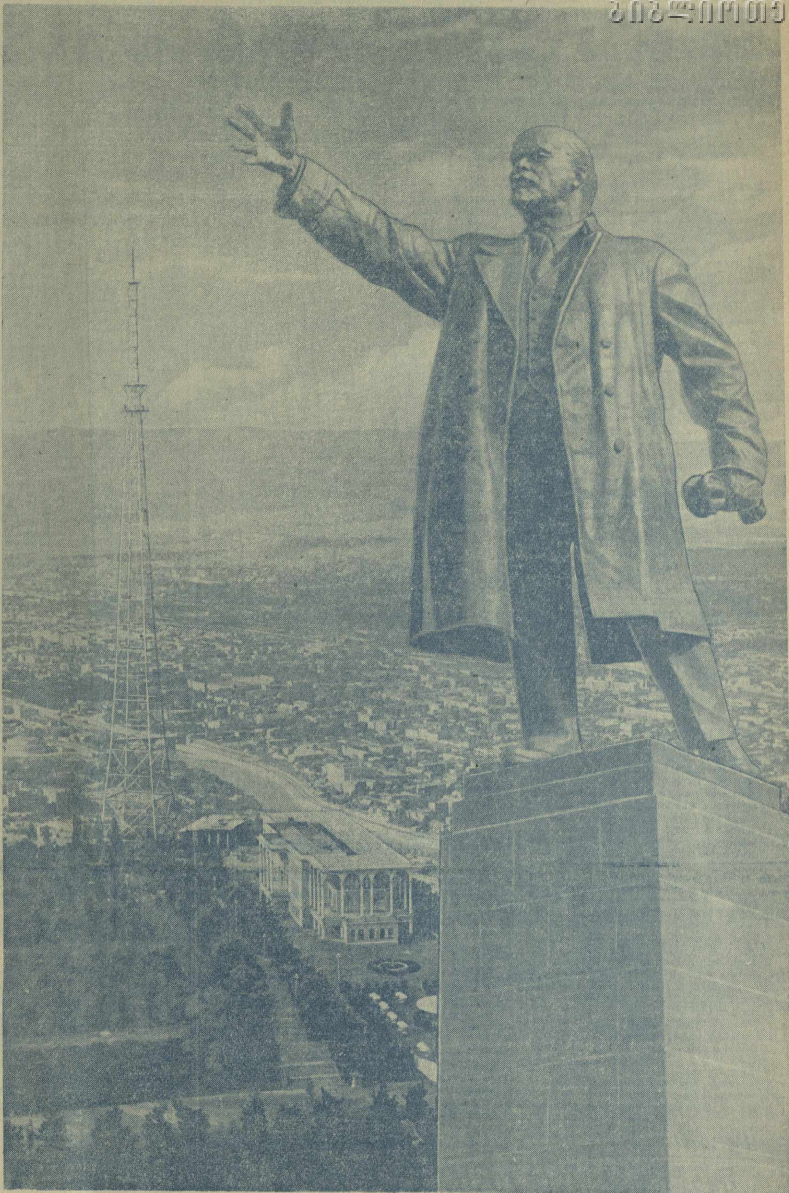
ЛЕНИН В ТБИЛИСИ

В своем национальном празднике грузинский народ пришел с замечательными творческими успехами. Он вдохновенно трудится над выполнением и перевыполнением заданий семилетки и под мудрым руководством Коммунистической партии, вместе со всеми братскими народами Советского Союза твердой поступью идет вперед к окончательной победе коммунизма.