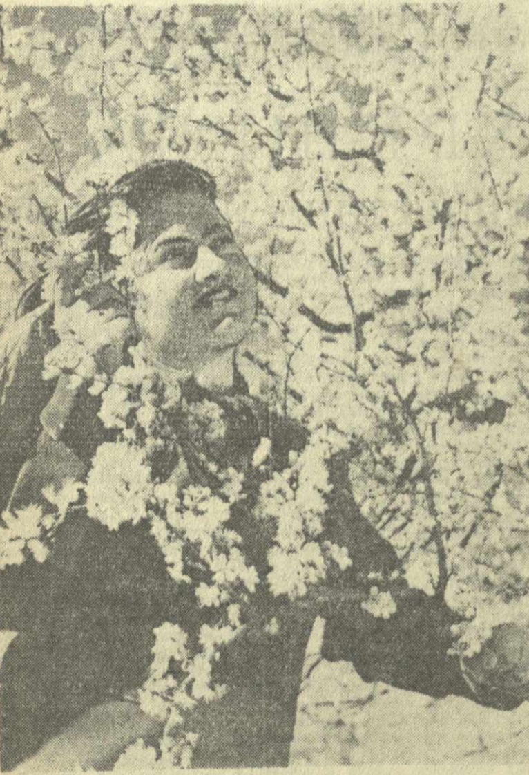
БЕЛЫМ ЦВЕТОМ ЗАЦВЕЛИ ТИЕМАЛИ...

пропацанды марксистско-ленинской информации — 317 03 писем и листовок — 317 03