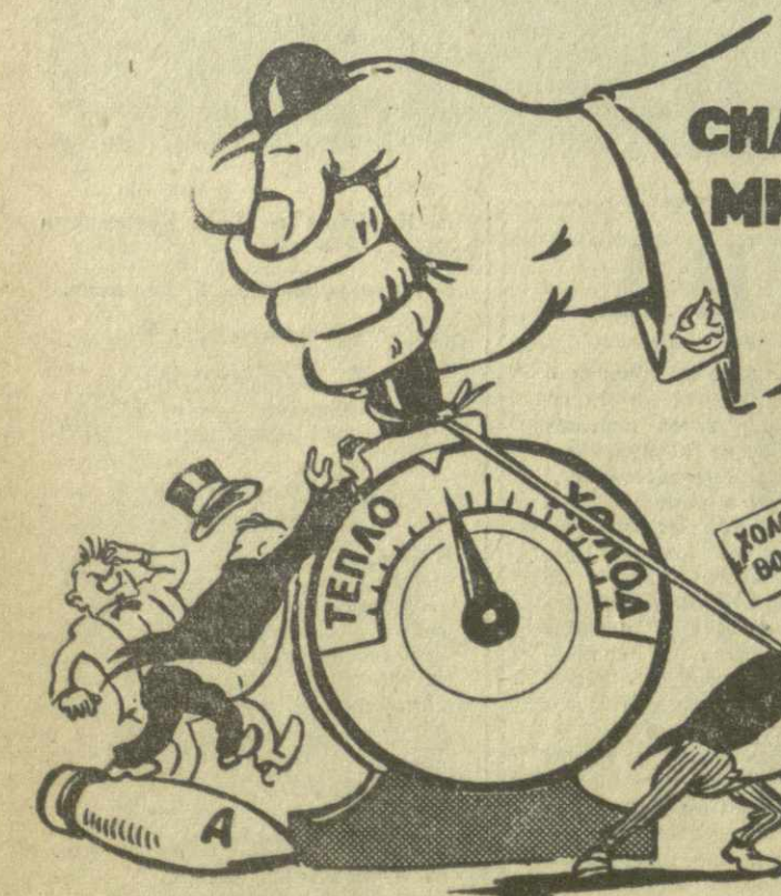
Еще на одно деление в сторону потепления. Рис. А. Канделаки.

...В человеческих отношениях зима не сменяется весной автоматически, как это происходит в природе... Установление тепла или холода в отношениях между людьми зависит от желания, от стремления придать ту или иную температуру этим отношениям, требует серьезных усилий. (Из речи товарища Н. С. Хрущева на приеме в муниципалитете Парижа 24 марта 1960 г.).