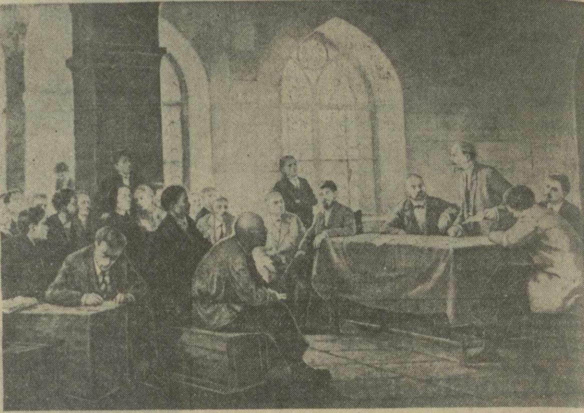
На снимке: репродукция с картины Р. Кекедзе «II съезд РСДРП» (фонд филиала Музея имени В. И. Ленина).

Во всех клубах и библиотеках района устроены выставки.