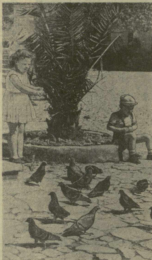
В погожий весенний день у юных сухумских голубеводов свои заботы.

За перевыполнение плана сдачи пушнины и уничтожение хищников, управление Цехаши и наградило охотника почетной грамотой.