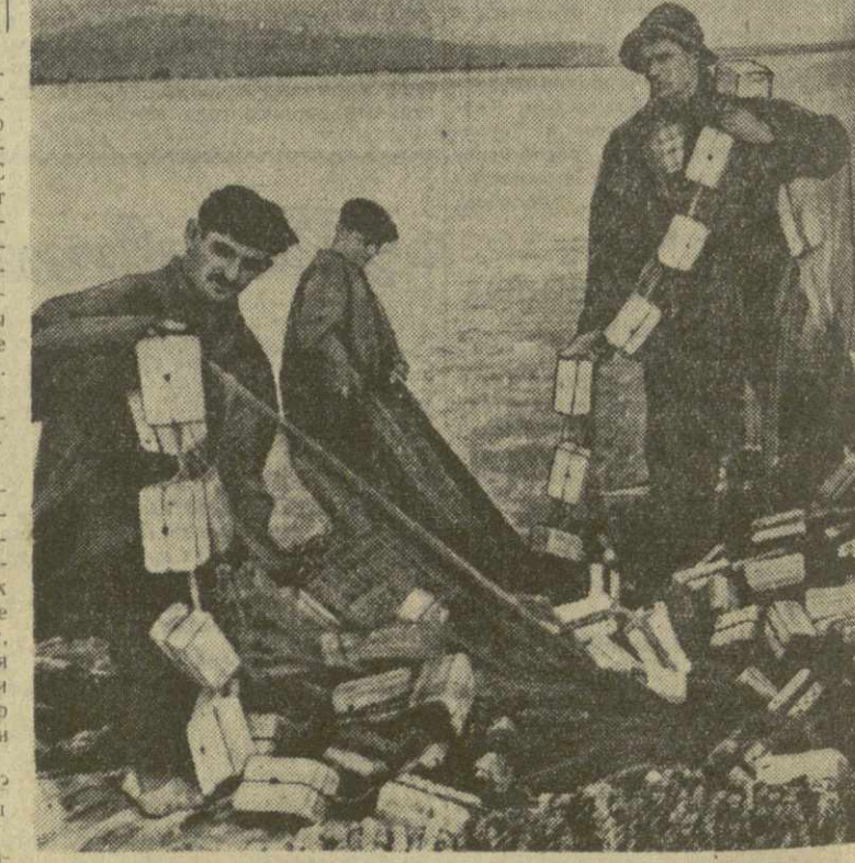
На снимке: перед началом лова.