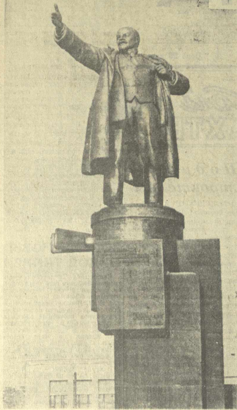
Ленинград. Памятник В. И. Ленину в Броневике.

сказывал на одном из собраний о событиях тех дней. И тут кто-то из слушателей спросил: «Где находится сейчас этот броневик?»