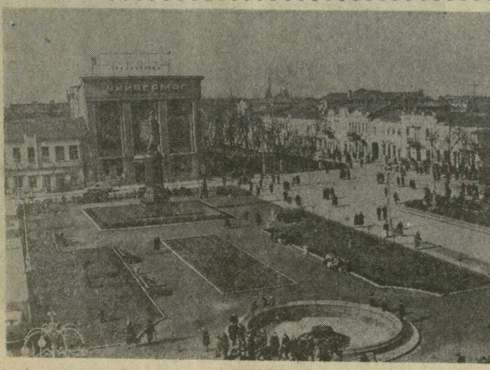
На снимке: Северо-Осетинская АССР. Город Орджоникидзе. Площадь имени В. И. Ленина.