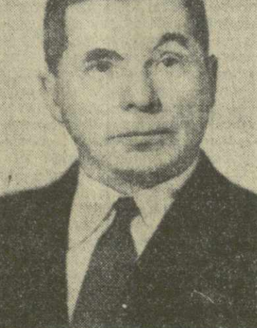
ИЛЮШИН СЕРГЕЙ ВЛАДИМИРОВИЧ, генеральный конструктор.