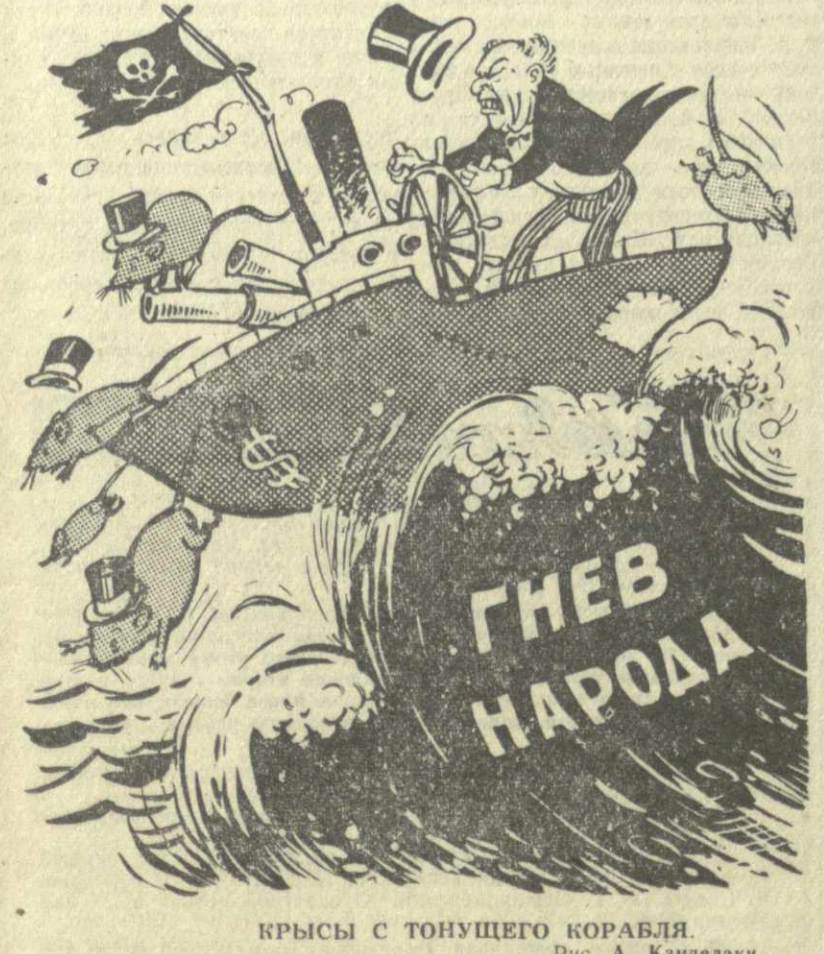
КРЫСЫ С ТОНУЩЕГО КОРАБЛЯ. Рис. А. Канделаки.

24 АПРЕЛЯ «КРАСНЫЙ МЕТАЛЛУРГ» (Липяна) — «ЛОКОМОТИВ» (Тбилиси) Начало в 3 часа дня.