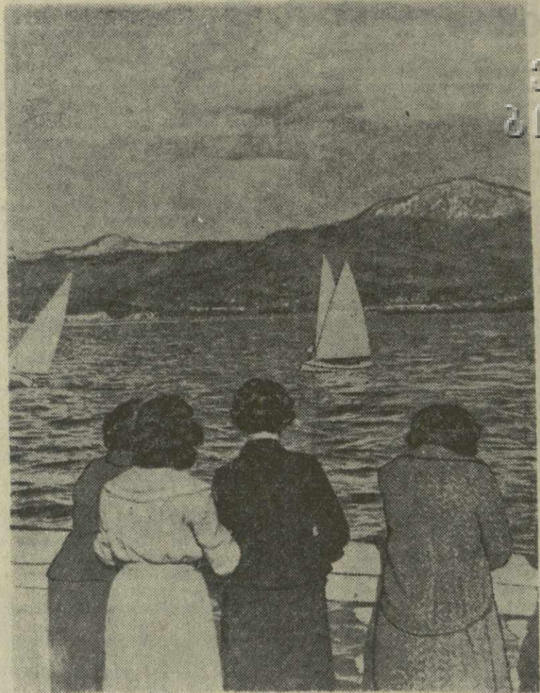
Свежий весенний ветерок радует батумских яхтсменов.

Это событие, пишет газета, еще раз доказывает, что Трухильо виновен в геноциде. Хотя это кажется невероятным, но все это было в действительности. Тираническое правительство Доминиканской Республики нарушило элементарные гуманные концепции для того, чтобы остаться у власти вопреки воле народа.