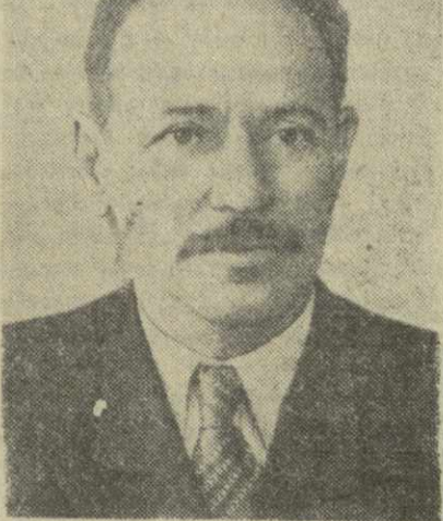
ШОЛОХОВ МИХАИЛ АЛЕКСАНДРОВИЧ, писатель.