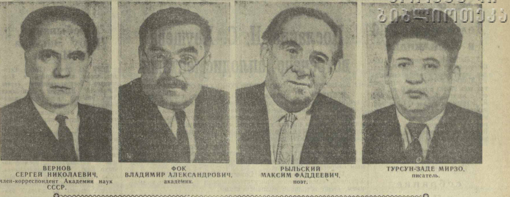
ВЕРНОЕ СЕРГЕЙ НИКОЛАЕВИЧ, член-корреспондент Академии наук СССР. ФОК ВЛАДИМИР АЛЕКСАНДРОВИЧ, академик. РЫЛЬСКИЙ МАКСИМ ФАДДЕЕВИЧ, поэт. ТУРСУН-ЗАДЕ МИРЗО, писатель.