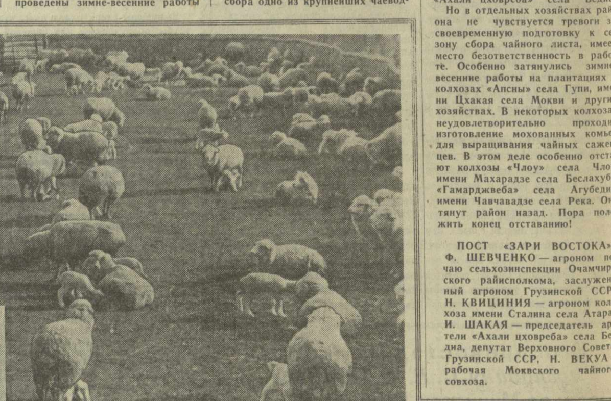
На зимних пастбищах