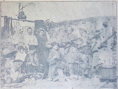
მწყემსების სადილობა თაეიანთ ბინაზე.