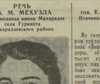
Молодежь Махарадзевского района бок о бок со старшими участвует в борьбе за крутой подъем колхозного и совхозного производства.

раюсь на наше совещание, колхозники артели поручили передать их просьбу: побольше доставляйте нам материала для изготовления железобетонных столбов. Это будет большой практической помощью для наших виноградарей.