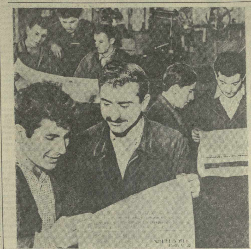
На снимке: рабочие и служащие Тбилисского завода шлифовальных станков во время перерыва знакомятся с материалами пятой сессии Верховного Совета СССР.

Горячую благодарность партии и правительства за миролюбивую политику высказали труженники колхозов сел Акура, Шаураури, Кондולי, Цинандали и др.