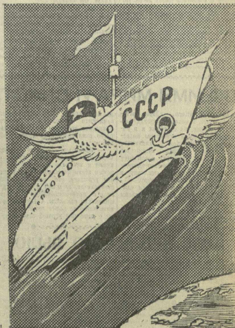
КОСМИЧЕСКИЙ КОРАБЛЬ БОРОДИТ ВОЗДУШНЫЙ ОКЕАН

Мичетский район к 15 мая выполнил план весеннего сева. Вместо предусмотренных планом 4420 гектаров засеяно 4447 гектаров. Сев продолжается. (ГрузТАГ).