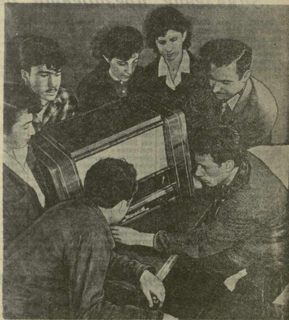
На снимке: группа рабочих тбилисского завода «Электровибромашина» слушает Заявление Никиты Сергеевича Хрущева.