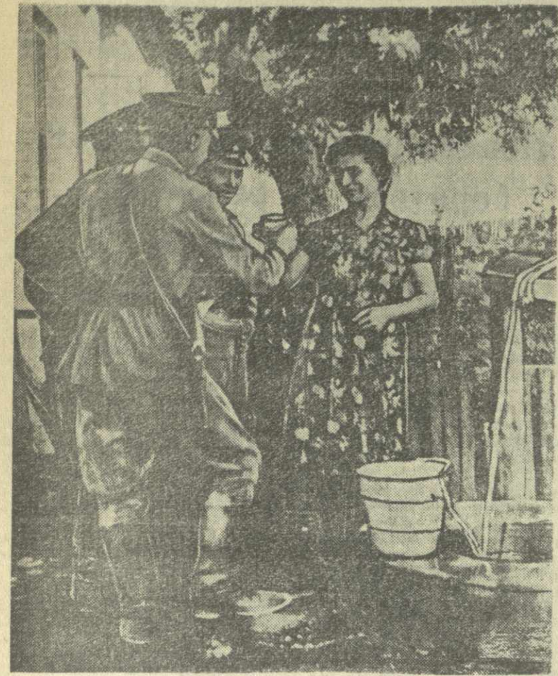
Шел со службы пограничник.

М. Дудучава — «Грузинская советская живопись». На грузинском языке. Издательство «Хеловнеба». 1959 г. 144 стр. Тираж 5.000 экз. Цена 32 руб.