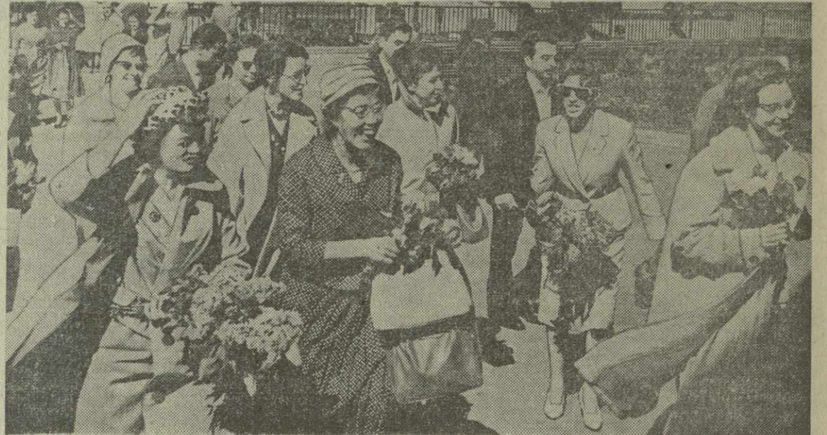
В Тбилиси прибыла делегация шведских женщин. На снимке: встреча делегации на Тбилисском аэродроме.

личные по жанру и характеру пьесы. В репертуаре театра преобладают произведения современной грузинской драматургии. В Тбилиси театр покажет семь спектаклей. Все они заслужили признание кутанского зрителя. Мы покажем тбилисцам пьесы «Изгнание» Важа Пшавелы, «Зари Кухиды» К. Лордкипанидзе, «Кварваре Гутаберги» П. Кабадзе, «Поворот» Д. Такташвили, «Крот» О. Чиджавадзе, «Дали негодяйные» Н. Вирты и «Отелло» Шекспира. Мы надеемся, что встреча с тбилисским зрителем принесет нам большую пользу, поможет лучше разобраться в удачах и недостатках работы творческого коллектива, явится стимулом к дальнейшему подъему творческой жизни кутанского театра.