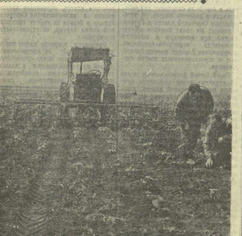
На полях колхоза имени Сталина села Земо-Мачхаи Цителкарского района, расположенных в Шираки, идет культивация подсолнечника, 620 гектаров отведено в этом году в артели под эту культуру. Большая часть площади засеяна квадратно-гнездовым способом.

Эти и другие недостатки, все еще имеющиеся в работе колхозной парторганизации, коммунисты, правления, сдерживают темпы, отрицательно сказываются на ходе выполнения обязательств. Только устранив их, парторганизация сможет рассчитывать на серьезный успех в выполнении колхозной семилетки.