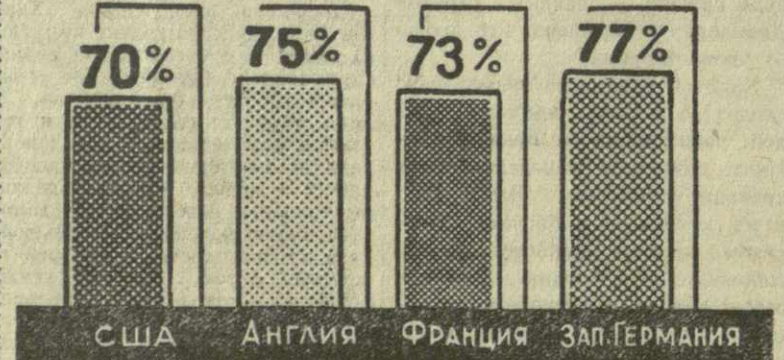
Удельный вес налоговых поступлений в общей сумме государственных доходов (без подоходного налога с корпораций) в 1958—1959 бюджетном году.