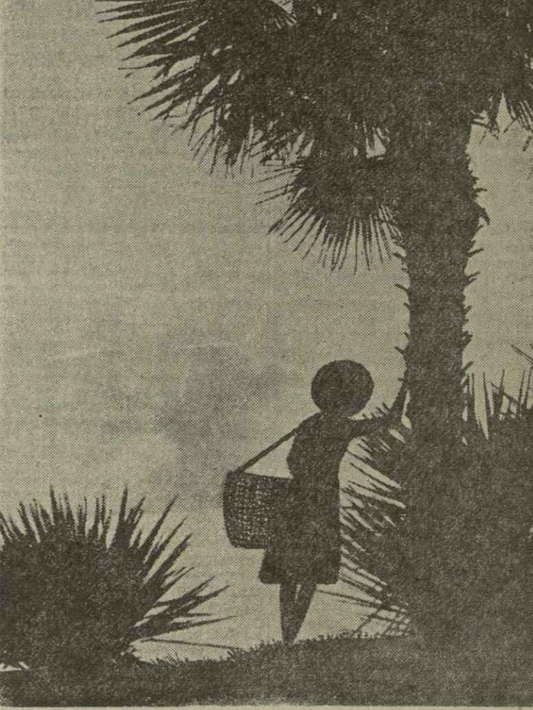
У самого синего моря. Фотохуд. С. Киладзе.

Пассажирский поезд Тбилиси — Телави подвезжал к станции Шрома. Машинист Гурджанского паровозного депо С. Мелиндзе неожиданно заметил, что через железнодорожное полотно пастухи перегоняют большое стадо овец.