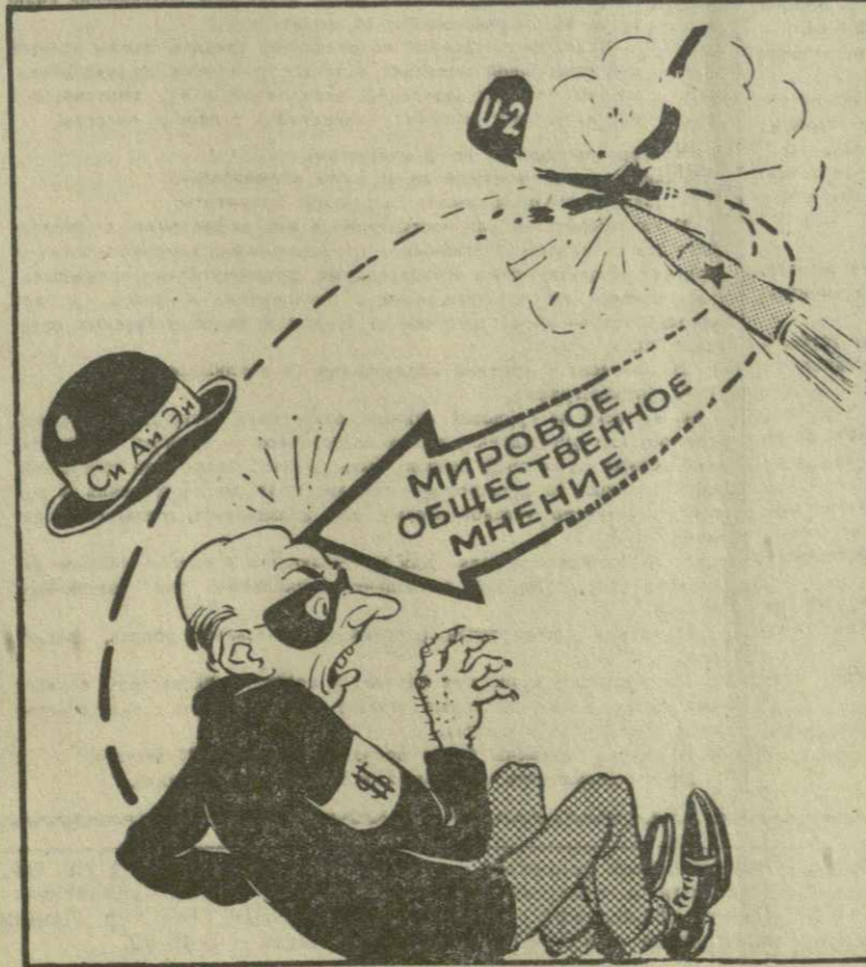
СОВРЕМЕННЫЙ БУМРАНГ Рис. А. Кандекали.