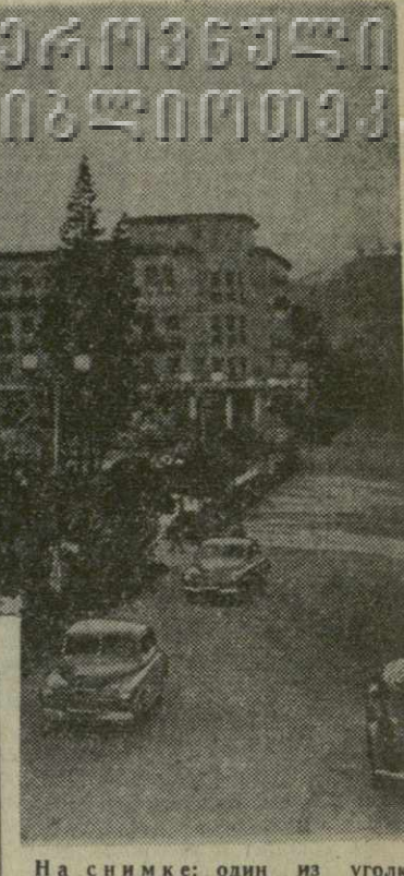
На снимке: один из уголков улицы Сталина в городе Кутаиси.