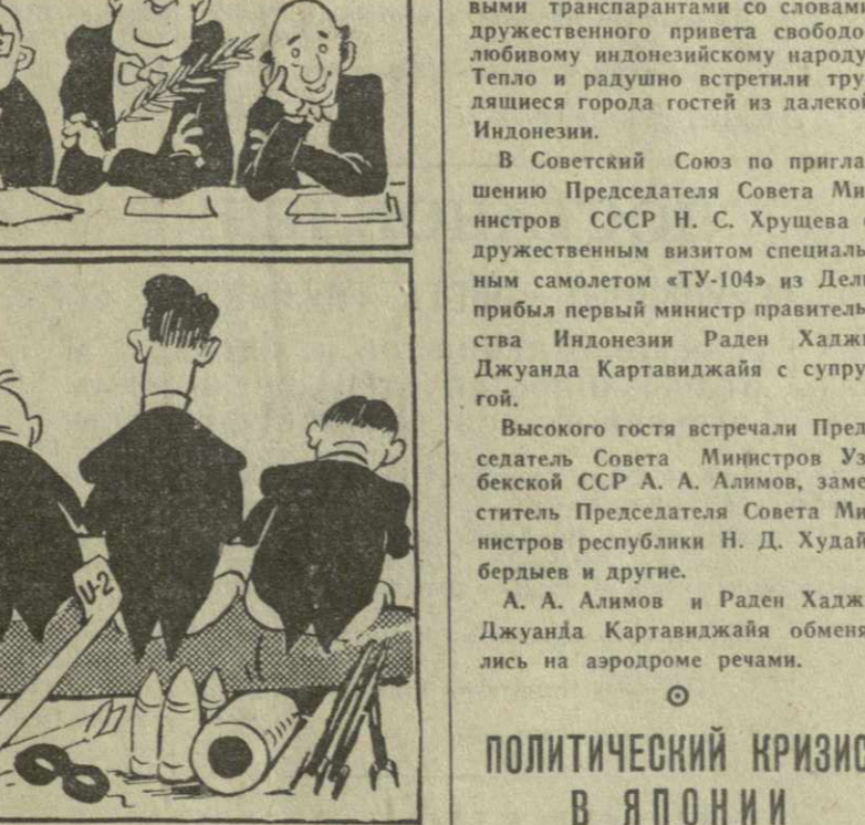
Рис. А. Кандекаки.