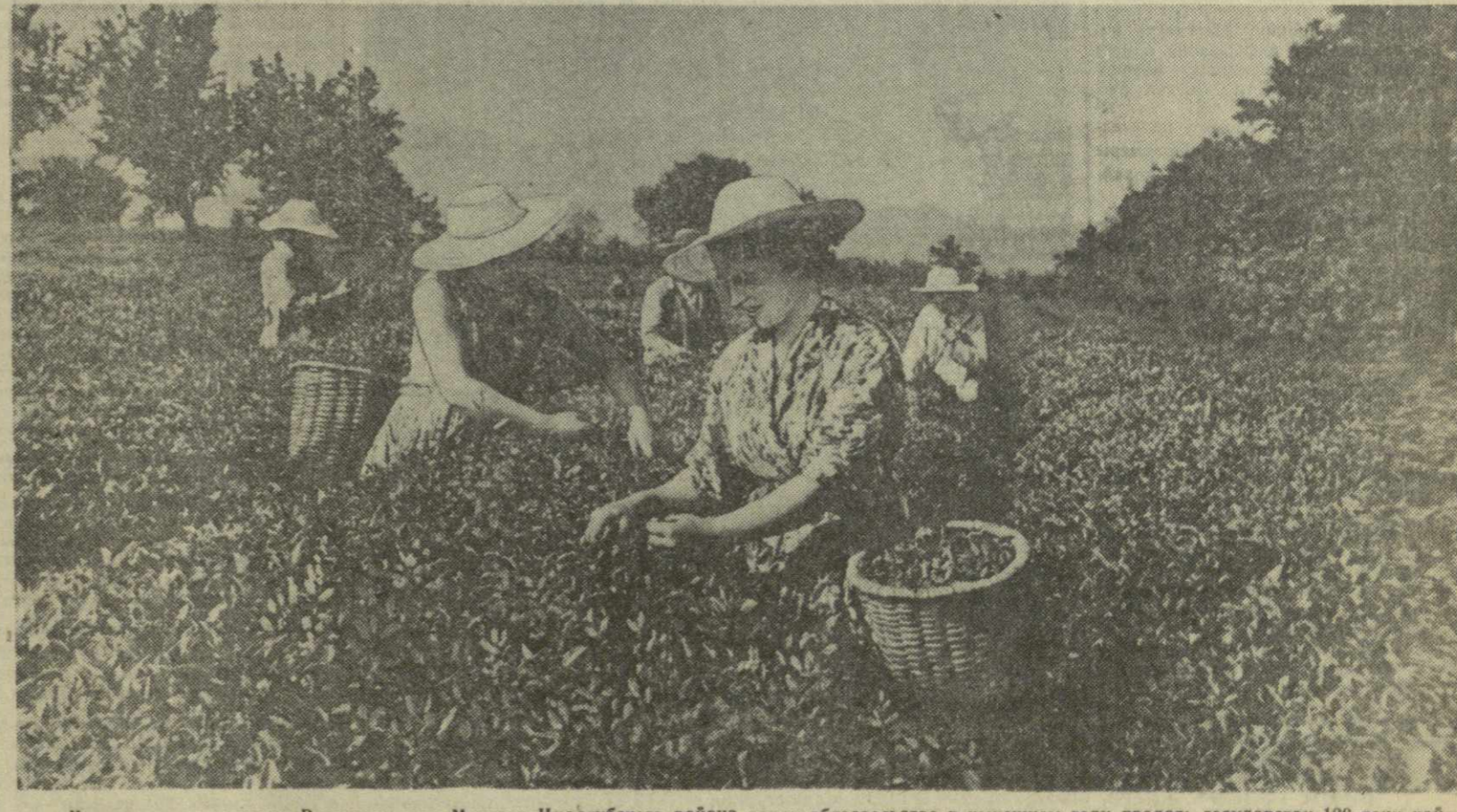
Чайевды колхоза имени Руставели села Маглаки Цхалтубского района взяли обязательство в нынешнем году продать государству 120 тонн чайного листа вместо предусмотренных планом 98 тонн. На чайных плантациях артели развернулась борьба за выполнение обязательства.