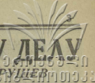
Н. С. ХРУЩЕВ