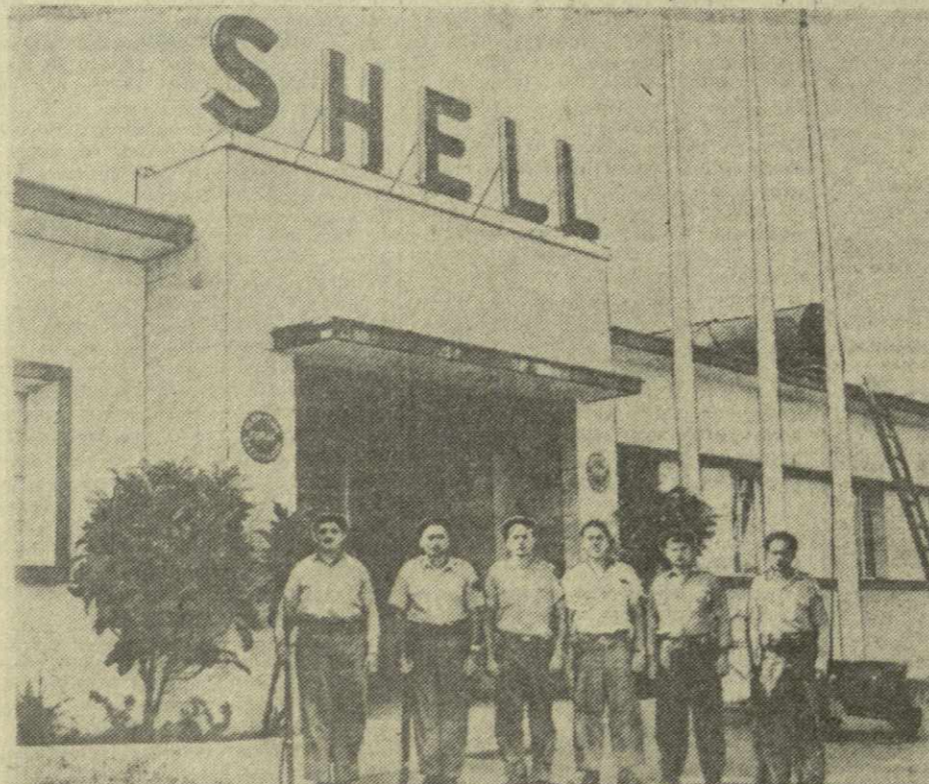
Куба. Недавно премьер-министр Фидель Кастро подписал декрет о переходе иностранных нефтеперерабатывающих предприятий на территории Кубы под контроль кубинского правительства. Декрет был принят с целью пресечения саботажа монополий США и Англии, отказавшихся перерабатывать нефть, закупленную Кубой за границей. На снимке: бойцы народной милиции — рабочие предприятия у завода компании «Шелл ойл» в Гаване.