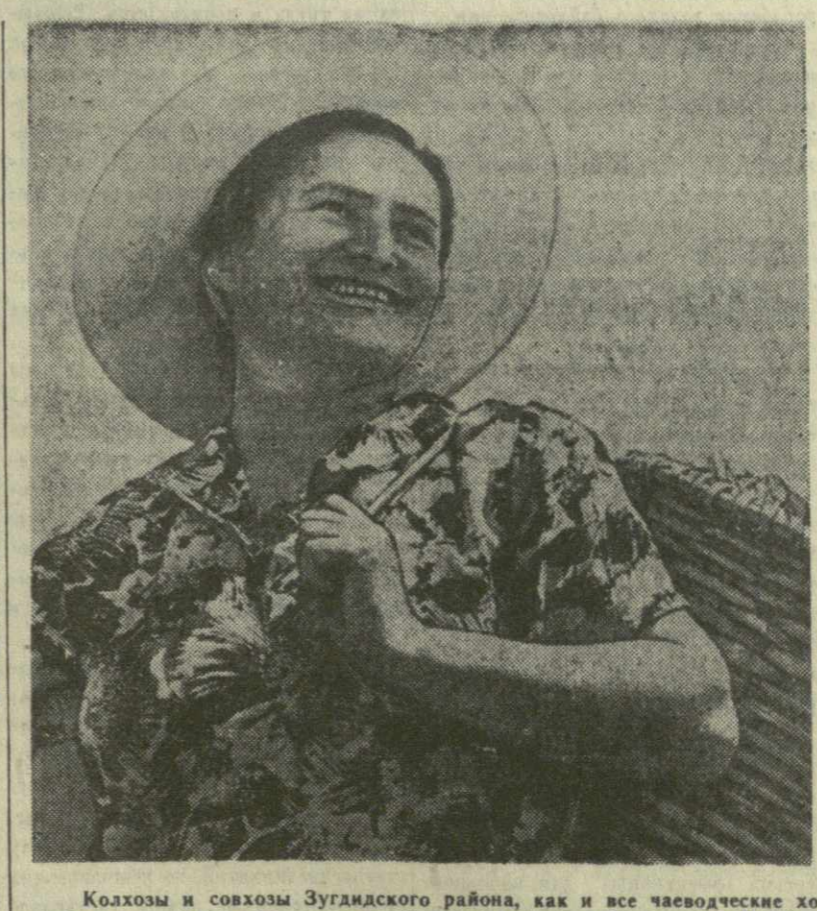
Колхозы и совхозы Зугдидского района, как и все чаеводческие хозяйства республики, с горячим одобрением встретили Обращение ЦК Компартии Грузии и Совета Министров Грузинской ССР. В ответ на Обращение 100 тонн сортового чайного листа.

Дать Родине 140 тонн «зеленого золота» сверх старых обязательств — таково решение нагомарских чаеводов.