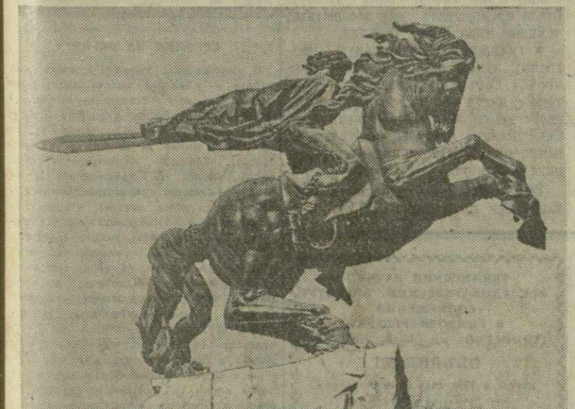
На снимке: памятник Давиду Сасунскому на привокзальной площади гор. Еревана.