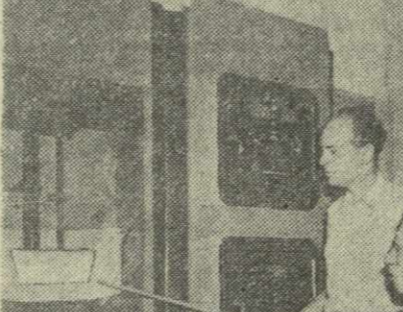
Работница в павильоне «Наука».

В Ташкенте команда «Пахтакор» приняла спартаковцев Еревана. Встреча закончилась ничью 0:0.