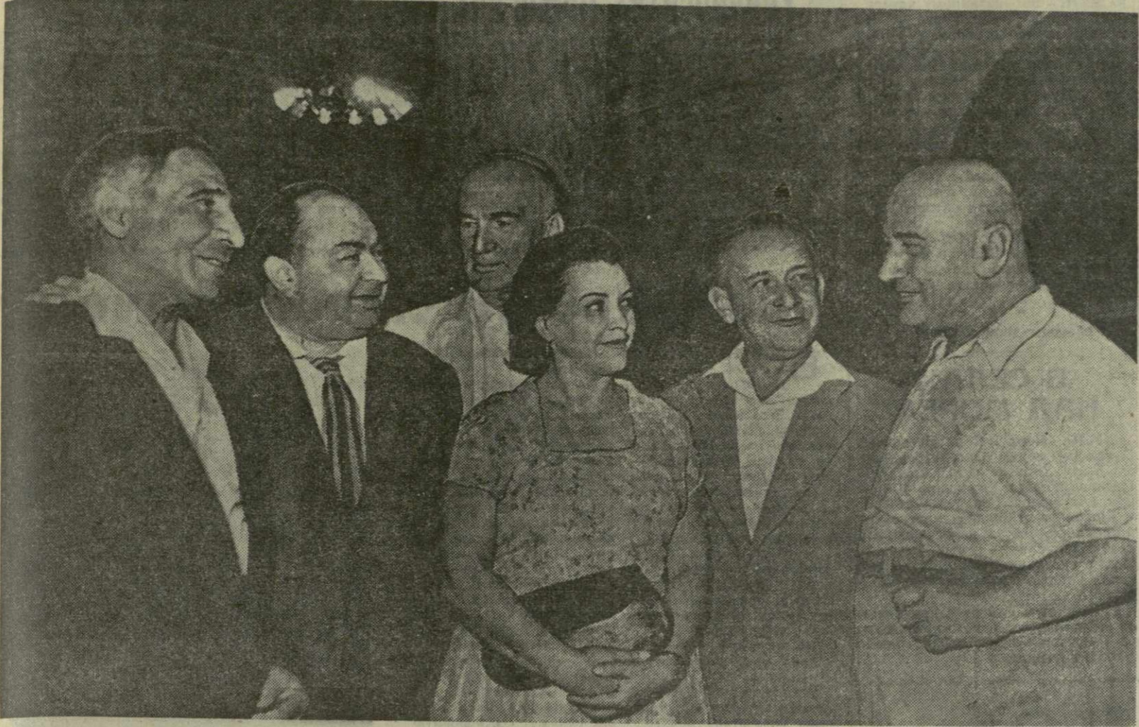
На снимке: грузинские и азербайджанские деятели искусств обмениваются мыслями после окончания спектакля «Вагиф». Слева направо: народный артист Азербайджанской ССР А. Герайбейли, народный артист СССР А. Искендеров, народный артист Грузинской ССР Д. Ангадзе, народная артистка Азербайджанской ССР О. Курбанова, народный артист Азербайджанской ССР А. Султанов, народный артист СССР А. Хораван.

К ИТОГАМ ГАСТРОЛЕЙ В ТБИЛИСИ АЗЕРБАЙДЖАНСКОГО АКАДЕМИЧЕСКОГО ДРАМАТИЧЕСКОГО ТЕАТРА ИМЕНИ М. АЗИЗБЕКОВА