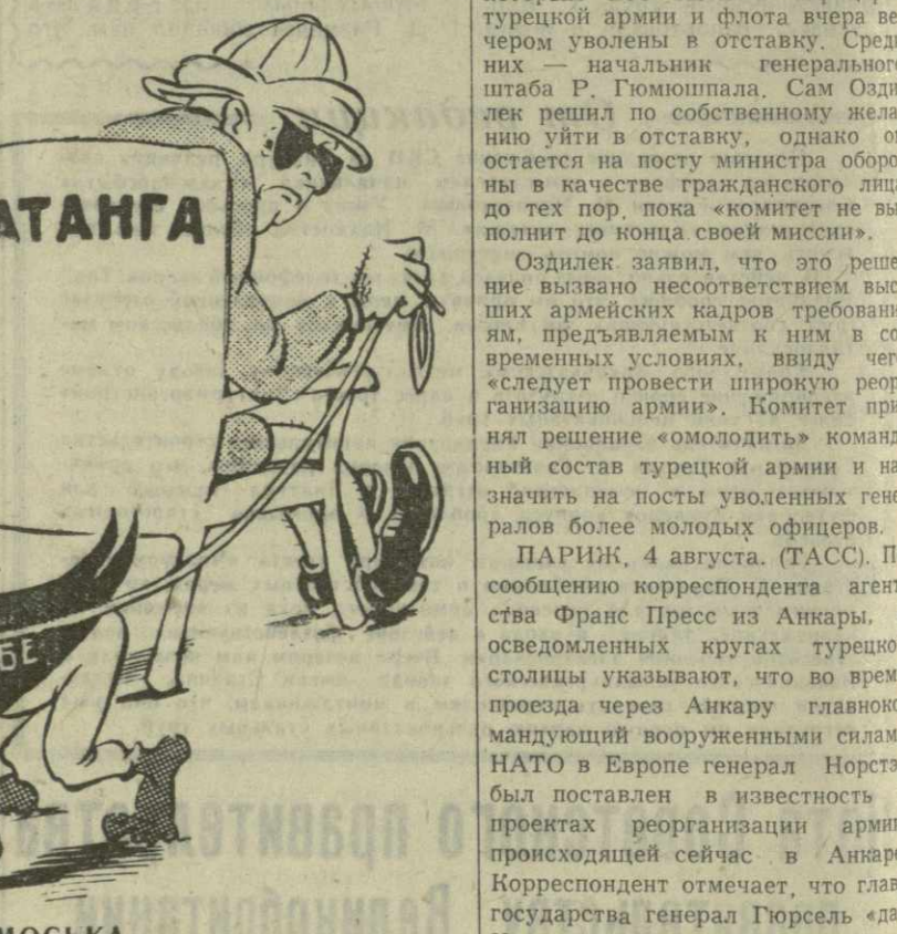
Рис. А. Кандекали.