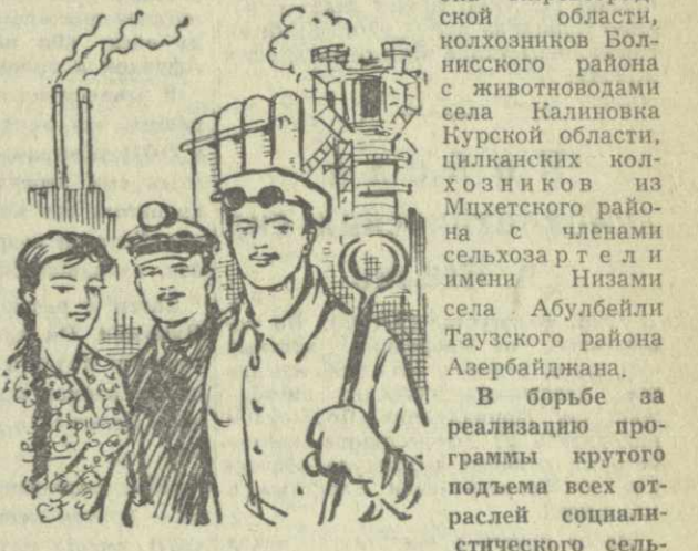
Украинского района Кировоградской области, колхозников Болнисского района с животноводом селения Калиновка Курской области. Украинских колхозников из Миченского района с членами сельхозартели имени Низами селения Абулбейли Таузского района Азербайджана.