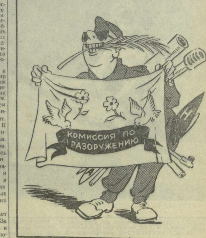
ФИГОВЫЙ ЛИСТОК ПЕНТАГОНА. Рис. А. Кандеаки.

Пятнадцать лет Индонезия идет под знаменем независимости. За это время республика окрепла и уверенно добивается новых и новых успехов.