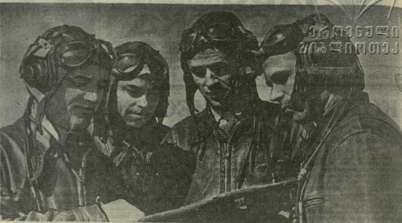
Отважные советские летчики зорко стерегут воздушные просторы нашей Родины, охраняя мирный труд и покой советского народа.

Воины авиации, глубоко преданные нашей великой Коммунистической партии, усилят свою бдительность, еще выше поднимут боевую готовность, будут и впредь с честью выполнять задачи по охране мирного труда советского народа, строящего коммунизм.