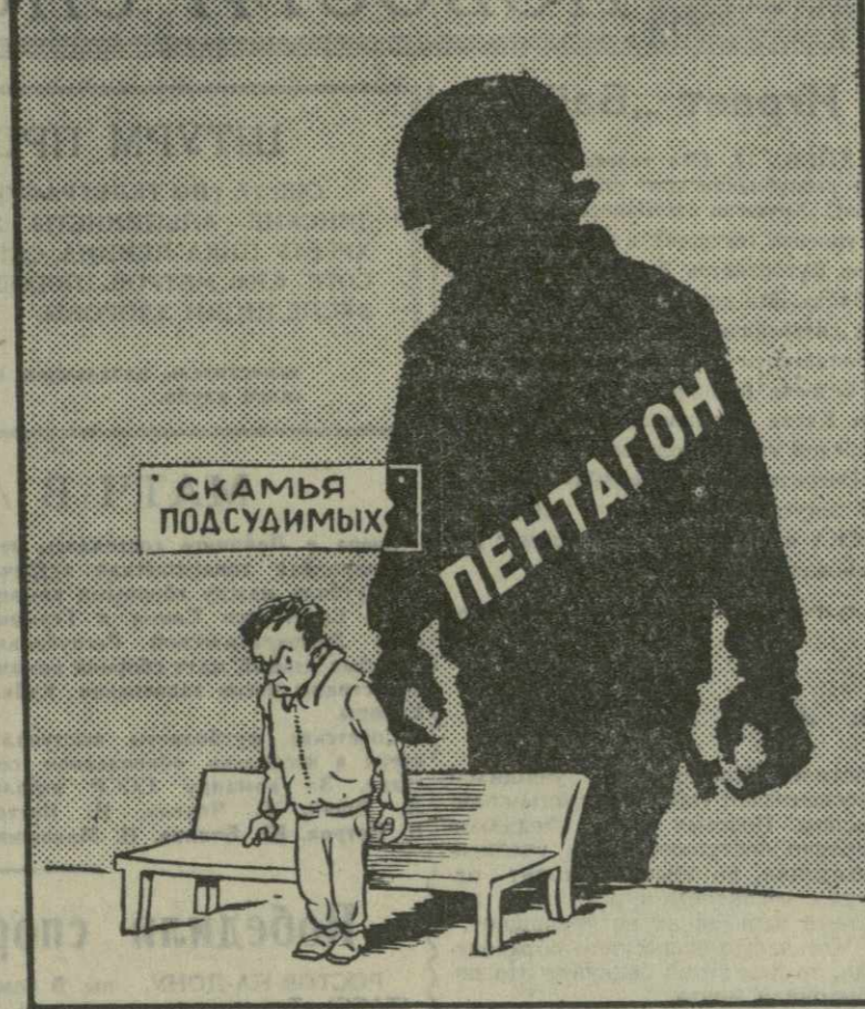
ТЕНЕВАЯ СТОРОНА ПРОЦЕССА Рис. А. Кандедаки.