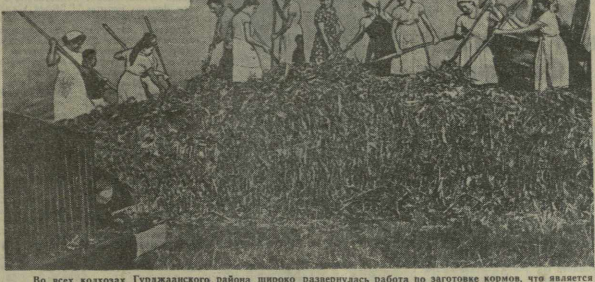
Во всех колхозах Гурджаанского района широко развернулась работа по заготовке кормов, что является основным условием для дальнейшего развития животноводства. Труженики района взяли в этом году повышенные обязательства. Они репшили, вместо 52 тысяч по плану заложить 65 тысяч тонн силоса. На снимке: молодежная кормодобывающая бригада артели села Мелали во время наземной закладки силоса.