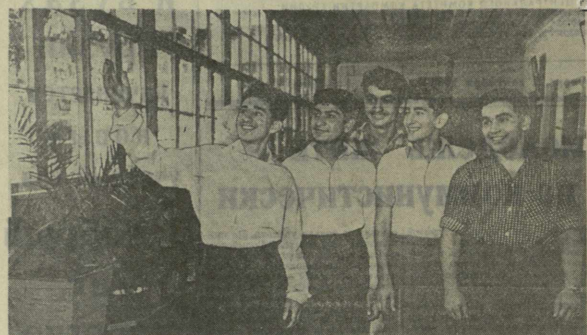
Вот они, члены ремонтной бригады, учащиеся 32-й средней школы.

Д. ГЛЮТИ, директор батумской средней школы-интерната.