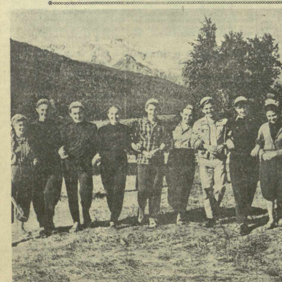
15 лет назад на пионерском сборе местийские школьники услышали рассказ о подвигах советских воинов, сражавшихся под Москвой, об их героизме и стойкости. Тогда же ребята решили написать своим московским сверстникам. Они просили их рассказать о столице, предлагали дружить. Летом 1953 года школьники из Местии побывали в Москве, а Местия москвичи — в Сухуми. С тех пор, пожалуй, каждый год встречаются друзья. Вот и в этом году, как только окончилась учеба, местийские и тбилисские пионеры выехали в столицу. Они весело провели время с московскими друзьями, совершили экскурсию по достопримечательным местам, а