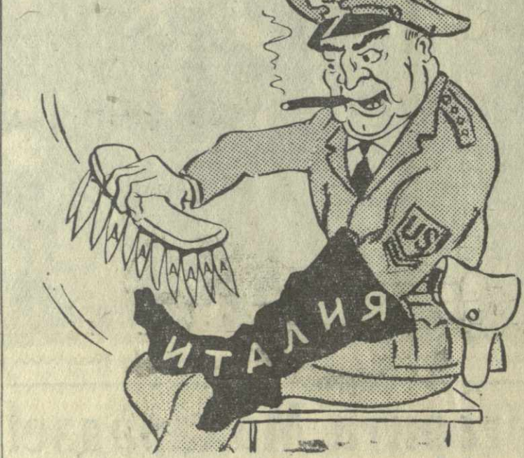
ЗАОКЕАНСКИЙ ЧИСТИЛЬЩИК САПОГ. Рис. В. Аброяна.

Патрис Лумумба, сообщает корреспондент каирского радио, выразил надежду, что сессия Генеральной Ассамблеи примет решения, направленные на защиту свободы и независимости Конго. Премьер-министр выразил также надежду, что в этих решениях будет указано, что ООН должна сотрудничать только с законным правительством Конго, т. е. с тем правительством, которое уполномочил парламент и которому парламент неоднократно выражал свое доверие, как единственно законной власти.