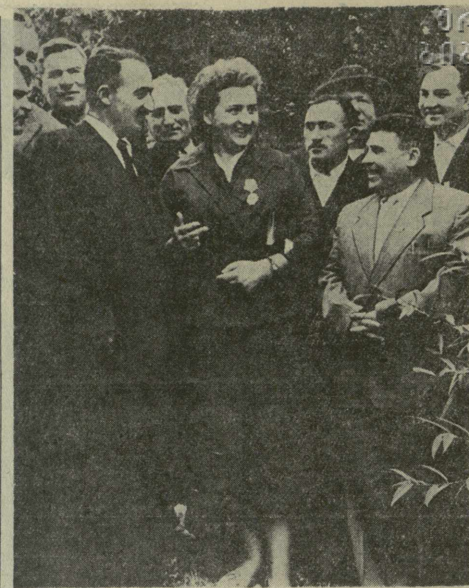
Оживленно беседуют члены делегации тружеников Сасовского района Рязанской области с колхозниками села Кода Тетрицкой области.

Помимо школьной мебели, фабрика выпускает спальные гарнитуры. Скоро на предприятии приступят к серийному выпуску ма-логабаритной мебели.