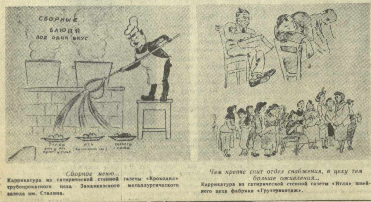
СБОРНЫЕ БЛЮДА ПОД ОДНИМ ВКУС