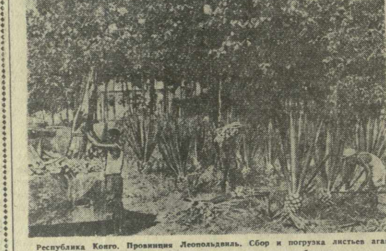
Республика Конго. Провинция Лопольдвиль. Сбор и погрузка листьев агамы, после переработки из них изготавливают канаты, сети, мешки и бумагу. Котонгоссес.