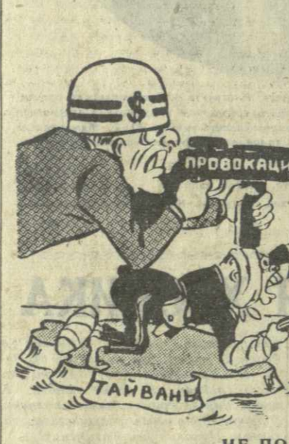
НЕ ПО ЗУБАМ Рис. В. Аброяна.