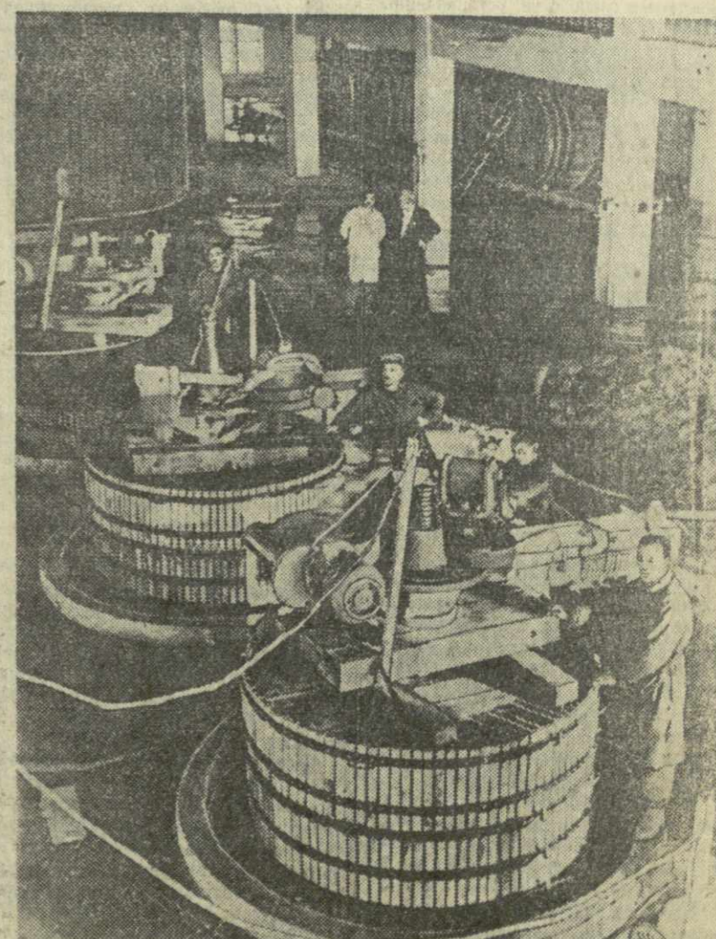
В Напареульском совхозе-заводе Телавского района в этом году вступило в эксплуатацию новое прессовочное отделение, которое в день перерабатывает свыше 120 тонн винограда. На снимке: общий вид нового прессовочного отделения.

Советское правительство, говорится в ноте, считает своим долгом еще раз предупредить правительство США об опасности предпринятого им курса и заявить, что Советское правительство не будет оставаться безучастным свидетелем ракетно-ядерного вооружения Западной Германии и будет вынуждено принять такие ответные меры, которые оно сочтет необходимыми для обеспечения безопасности Советского Союза и союзных с ним государств, для обеспечения мира в Европе и во всем мире. (ТАСС).