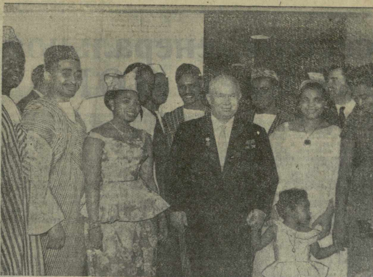
Нью-Йорк, 2 октября Н. С. Хрущев присутствовал на приеме, устроенном по случаю национального праздника Гвинеи главой делегации Гвинеи на XV сессии Генеральной Ассамблеи ООН Исмаилом Туре. На снимке: во время приема.