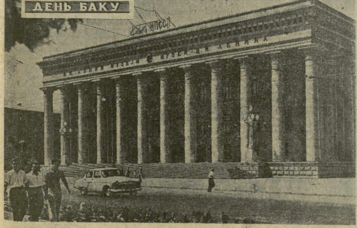
Музей Ленина в Баку

Н. С. Хрущев пожелал президенту Сукарно счастливого пути и успеха в его деятельности на благо народа Индонезии и всеобщего мира.