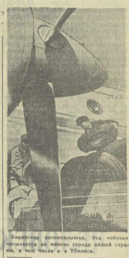
Бакинские автопопрышки. Эта «обува» посылается во многие города нашей страны, в том числе и в Тбилиси.

Экипажу теплохода «Сокол» объявлена благодарность.