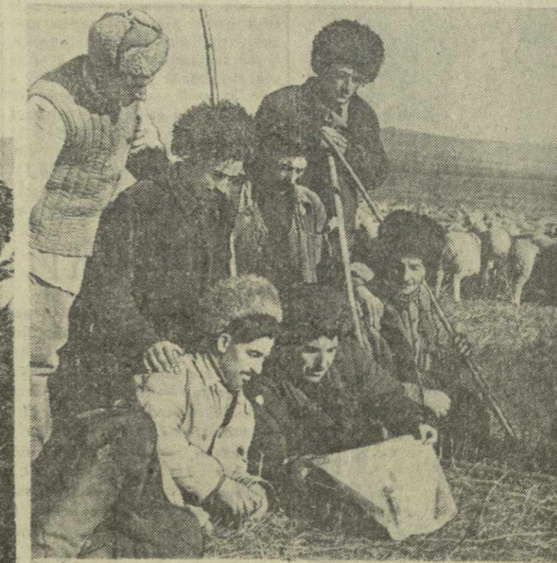
Интересно и весело было на слете чабанов в Ачалуках. В гости к мужественным овцеводам приехали участники ансамбля песни и танца. Горячее внимание чабанов привлекали и молодые борцы, схватившиеся здесь же, в центре лагеря на ковре под одобрительные возгласы всех присутствующих. После того, как животноводы и их многочисленные гости осмотрели выставку достижений овцеводов нашей республики на северокавказских зимних пастбищах, веселье вспыхнуло с новой силой.

На снимках: овцеводы смотрят выступление ансамбля песни и танца; (вверху) — на отдыхе.