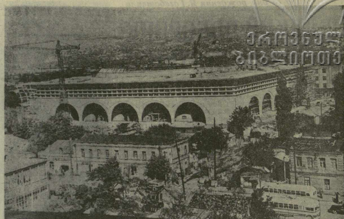
Убираются леса, все отчетливее вырисовываются контуры будущего здания. Пройдет еще несколько месяцев, и грузинские спортсмены к славной дате 40-летия республики получат замечательный подарок — Дворец спорта.

Выступившие по докладу Г. Натадзе делегаты указывали на необходимость дифференциации физиологических норм питания, разработанных в свое время Институтом питания Академии медицинских наук СССР. В этих выступлениях указывалось, например, что нельзя считать правильным то, что для населения Карелии и Грузии рекомендуются одни и те же физиологические нормы питания. Вряд ли правильно сейчас строить нормы питания только на основе энергетических затрат организма, тем более, что уровень последних резко упал в связи с механизацией и, авто-