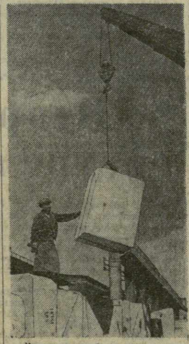
Мраморная глыба в воздухе. Еще мгновение, и подземный кран перенесет ее в вагон для транспортировки в камераспиловочное отделение.

Несколько лет тому назад, рассказывает Георгий Ираклиевич, мы отправили большую партию мрамора для строительства Варшавского Дворца культуры и науки. Спустя некоторое время польские друзья прислали нам диплом с благодарностью. Двор Тбилисского каменобрабатывающего комбината напоминает строительную площадку. Здесь грудой лежат мраморные глыбы — бело-серый лопотский и сванетский мрамор, красный и белый ираклинский — шрошинский, красный с большими белыми прожилками — салетский, темно-серый — салахлинский, коричневый с причудливыми черно-серыми узорами — молитский.