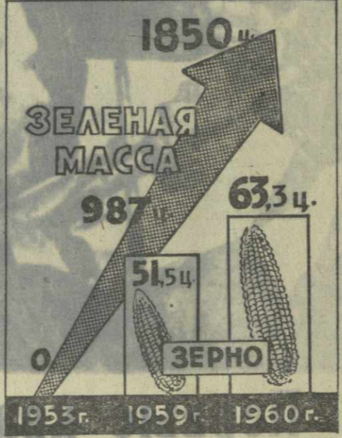
Рост урожайности зерна и зеленой массы кукурузы.

хозяйств, добившихся замечательных урожаев зерна и зеленой массы кукурузы, назвал колхоз «Политотдел» Верхнечирчикского района Ташкентской области Узбекистана. «Заря Востока» командировала в колхоз «Политотдел» своего корреспондента, рассказ которого и выступления передовиков этого замечательного коллектива помещены на этой странице.