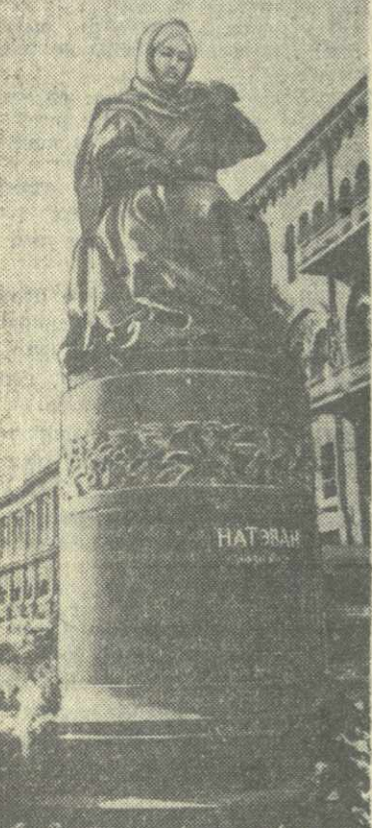
Баку. Памятник выдающейся азербайджанской поэтессе Натаван.

В этом году поисковые работы намечено провести также в Ахалцихском, Аспиндзском и Адигенском районах.