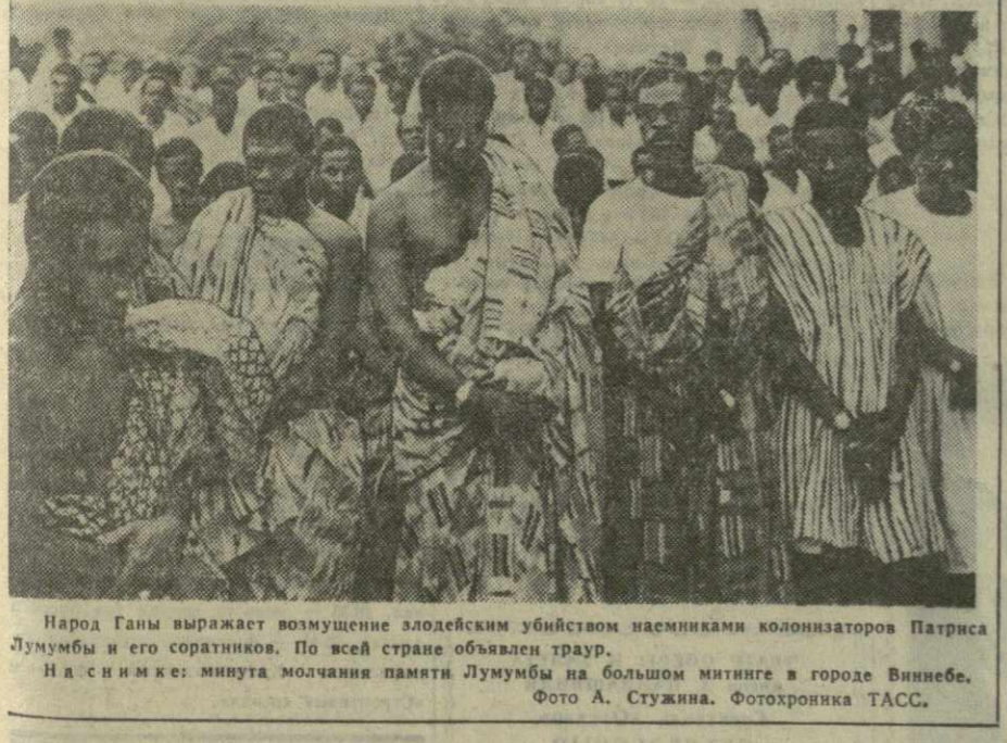
Народ Ганы выражает возмущение злодеянием убийством наемниками колонизаторов Патриса Лумумбы и его соратников. По всей стране объявлен траур. На снимке: минута молчания памяти Лумумбы на большом митинге в городе Виннебе.

Вынесение оправдательного приговора, пишет сегодня газета «Унита», явилось тяжелым ударом для монополистов.