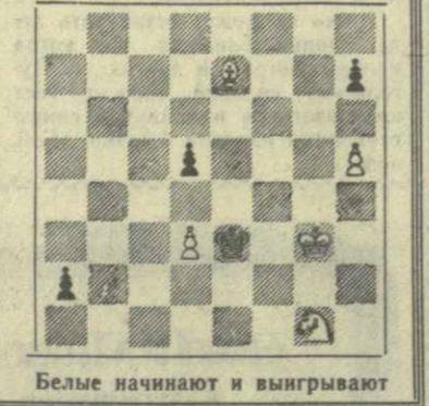
Белые начинают и выигрывают

На первый взгляд у белых материальный перевес — у них лишние конь и слон. Но нельзя забывать, что пешка черных, достигшая второй горизонтали, готова превратиться в ферзя. И, очевидно, превратится. Как же белым добиться победы? Подумайте над этим.