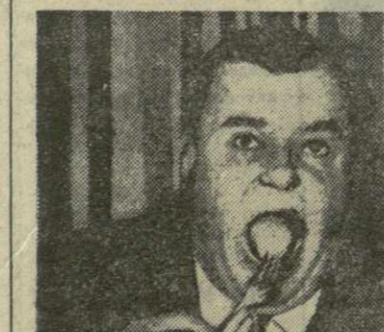
съел 24 вот такие огромные миски вареного картофеля.

Спектакль «Отелло», ОБЪЯВЛЕННЫЙ на 26 февраля для 3-го абонемена, ПЕРЕНЕСЕН. О дне спектакля будет объявлено особо.