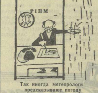
Так иногда метеорологи предсказывают погоду