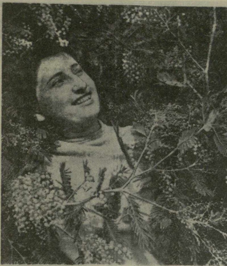
Цветет мимоза.

Советское правительство ожидает, что будут приняты меры к выдаче советским властям военного преступника Вика Эрвина-Рихарда-Адольфа Петровича. (ТАСС).