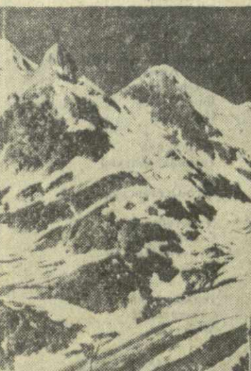
Ледяные глыбы, большой снег, шероховатые выступы скал... И в этом белом безмолвии приоткрылись легкие палатки исследователей ледника Тивбери.

Эти горы покрывают альпийские и гляциологические, которых олицетворяет отчаянный мужество, упорство и смелость. Но... первыми в лучшем случае, покоряют неприступные вершины и, очарованные красотой ледяного без-