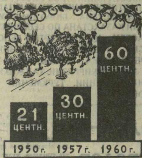
Почти в три раза выросла урожайность садов в Адигенском районе.