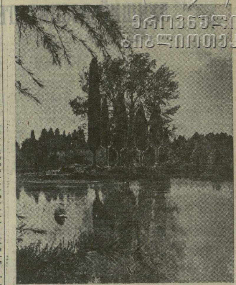
Отражение стройных кипарисов тихо колыхнется в глади озера. Таких чудесными уголками богата Пиунда.

НЬЮ-ЙОРК, 27 октября. (ТАСС). Глава провинциального правительства Леопольда Лумумба провел сегодня в Леопольде пресс-конференцию, на которой потребовал созыва конголезского парламента. Этот парламента, который, как отмечает в этой связи агентство Юнайтед Пресс Интернешнл, горячо поддерживает Лумумбу, Мобуту объявил распущенным.