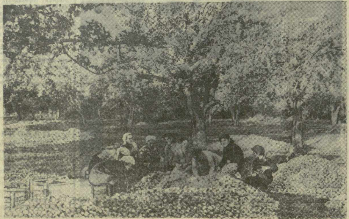
На снимке: сортировка яблок в Адигенском овоше-молочном совхозе.

Почти в каждом селе сейчас от- крыты новые магазины. — в Ча- хани, Бенара, в Леловнии, в Чеч- ла... А сколько новых школ по-