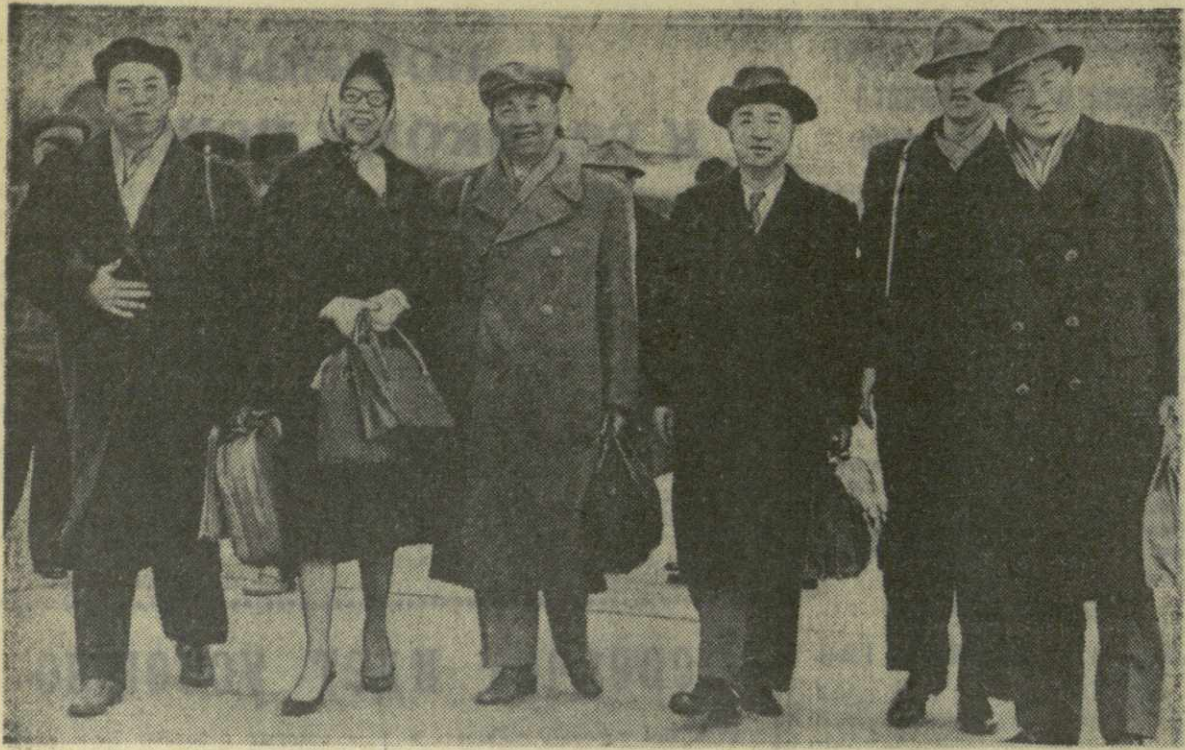
Китайские журналисты на Тбилиском аэродроме.