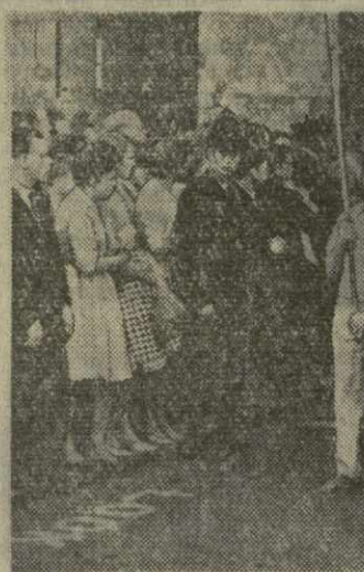
Англия. В течение трех недель продолжался поход сторонников ядерного разоружения по маршруту Эдинбург—Лондон. В столице страны состоялась демонстрация участников похода. На площади Трафальгар-сквер проведен массовый митинг. Выступавшие требовали отказа Англии от ядерного оружия и ликвидации баз США на Британских островах.

Выступивший первым представитель СССР В. А. Зорин заявил: Соединенные Штаты продемонстрировали вчера свое полное пренебрежение к Генеральной Ассамблее, недвусмысленно давая понять, что им вовсе не требуется прилагать особых усилий для обоснования своей позиции, какой бы сомнительной она ни являлась, и что без этого они еще в состоянии скотлить механическое большинство в поддержку предложения, каким бы вредным для дела мира оно ни было. С другой стороны, красноречивое молчание делегации США не может не настораживать членов Генеральной Ассамблеи. Не кроется