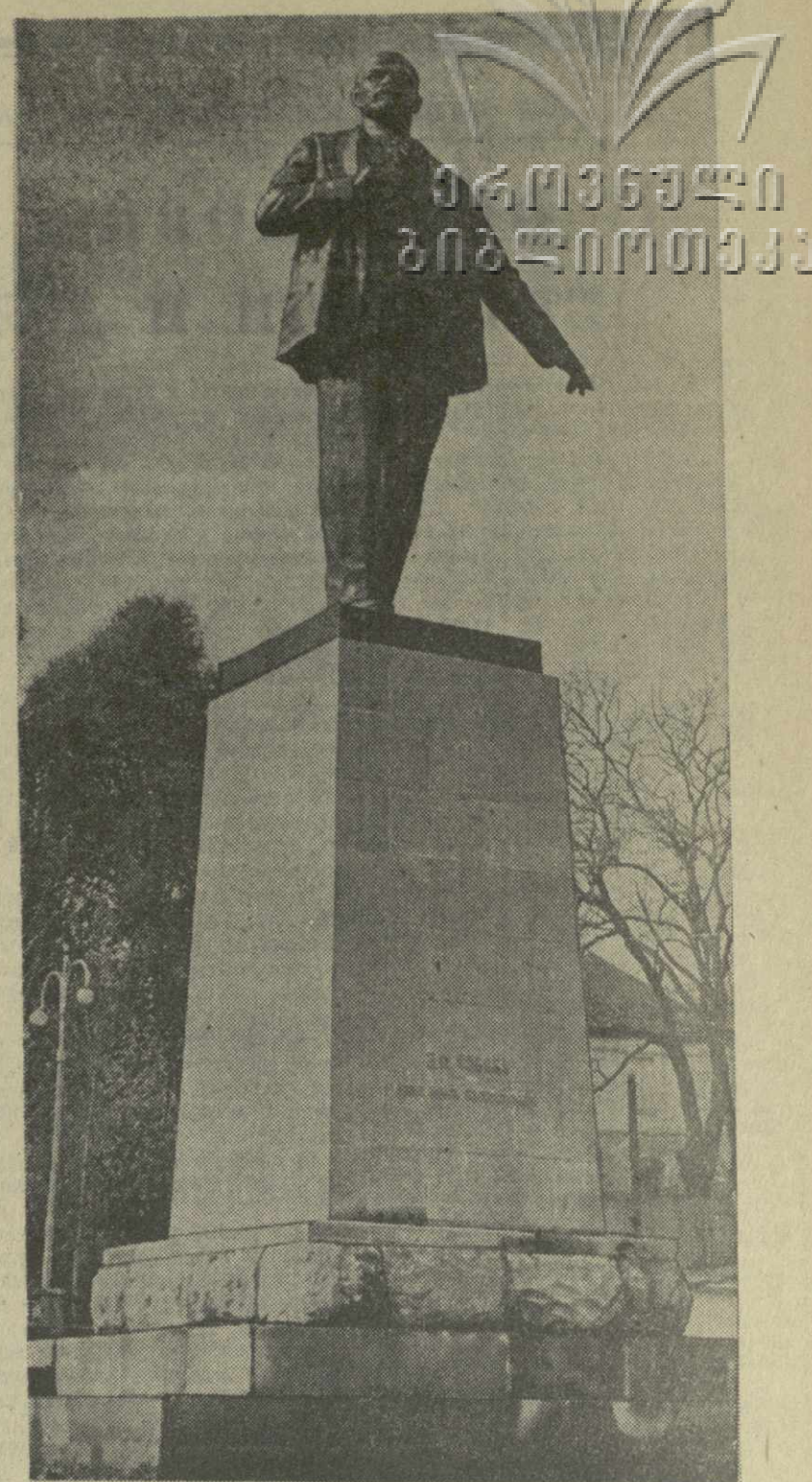
Сегодня в районном центре Тетри-Цкаро открывается памятник В. И. Ленину работы скульптора К. Мерабшвили. На снимке: памятник В. И. Ленину в Тетри-Цкаро.

АСПИНДЗА. (Корр. «Заря Востока»). Колхозники сельхозартели имени Орджоникидзе села Идумала Аспиндзского района, развернув социалистическое соревнование в честь 43-й годовщины Великого Октября и 40-летия установления Советской власти в Грузии, досрочно выполнили взятые обязательства. Государству продано 427 центнеров мяса и 1.112 центнеров молока. Значительно перевыполнено обязательство и по продаже государству яиц. Хорошую инициативу проявила молодежь артели. 17 комсомольцев откормили по одной свинье весом 90—110 килограммов каждая и сдали их колхозу.