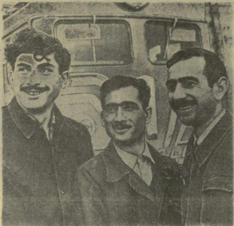
На Тбилиском электровозостроительном заводе имени В. И. Ленина широко развернулось соревнование в честь XXII съезда КПСС и XXI съезда Компартии Грузии. В авангарде соревнования идут разведчики будущего — бригады и ударники коммунистического труда.

Государственное издательство «Сабхота Сакартвело» выпускает много новых книг, научно-популярных брошюр и плакатов, посвященных подготовке к XXII съезду КПСС. Вышла в свет книга кандидата экономических наук В. Курашвили «Жизненный уровень советского человека в 1965 году».