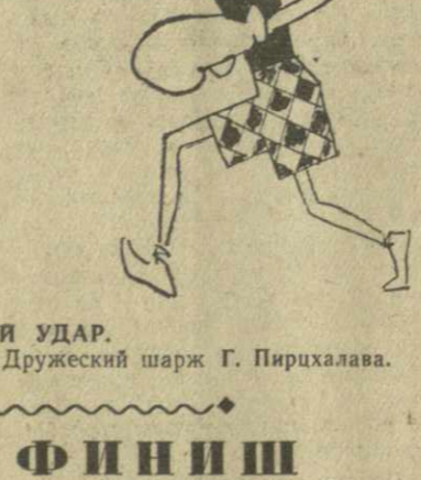
СКОРО ФИНИШ. Близится к концу IX традиционная женская спартакиада города Тбилиси, в которой участвуют физкультурницы 13-ти предприятий.