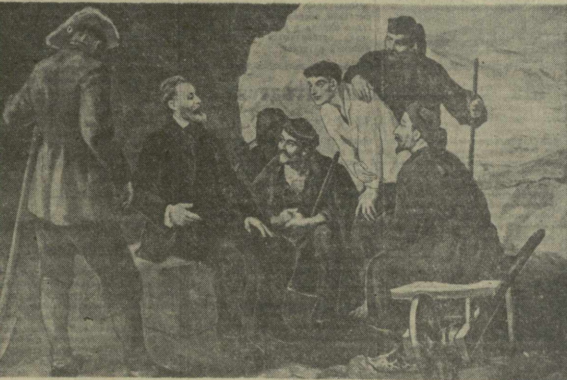
Этот снимок является репродукцией с картины лауреата Сталинской премии И. Тондзе. Это одна из серии картин, посвященных художником 120-летию юбилею великого поэта Грузии А. Церетели. Все они вскоре займут почетное место в музее поэта в Сакхере.

В Вильнюсе, Каунасе, Риге, Таллине — повсюду выступил отца и сына сопровождал неизменным успехом. Там же встретили своего коллегу прибалтийских композиторов. В дружеских встречах и беседах они живо интересовались достижениями грузинской музыкальной культуры, знакомились со своими новыми произведениями, советовались, обменивались мнениями.