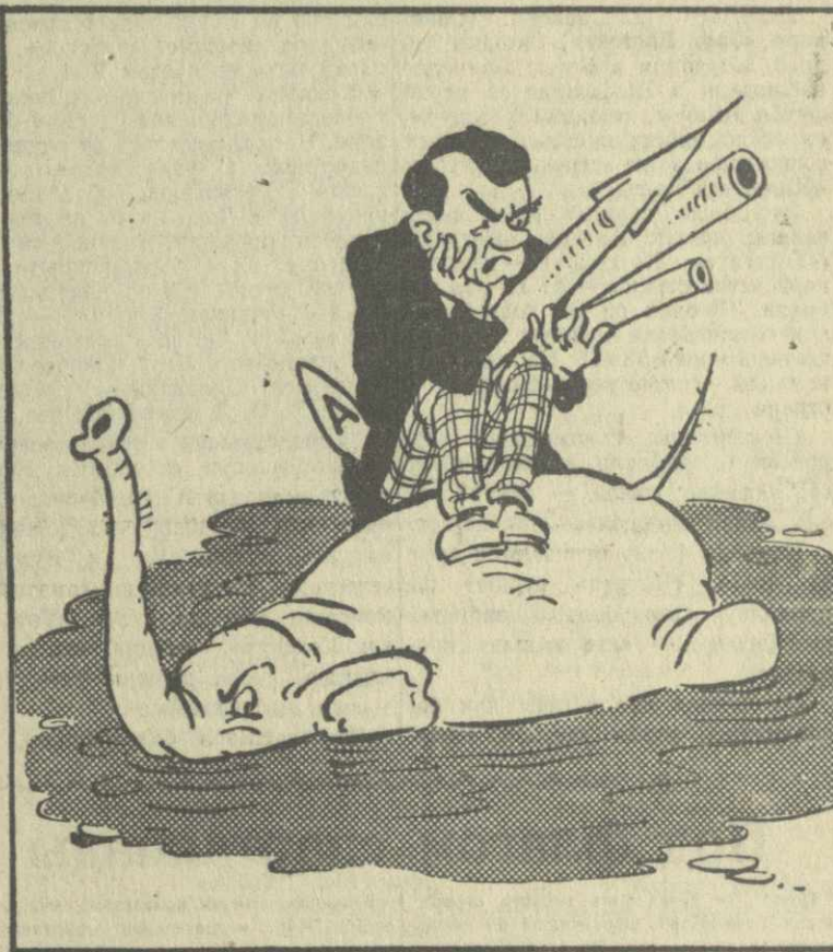
Рис. А. Канделани.