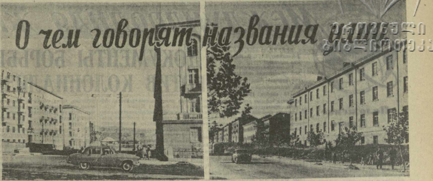
На снимках: сегодня на улице Канделани.

В. БЕБУТОВА-ГАБУНИЯ, заведующая музеем республиканского Дома народного творчества, заслуженный деятель искусства Грузинской ССР.