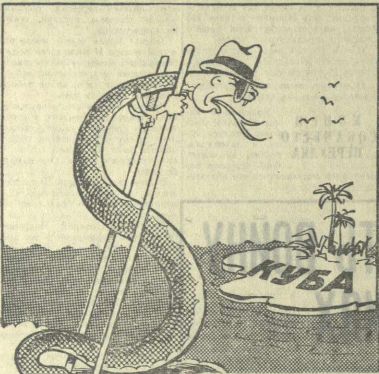
Рис. А. Канделаки.

пации власти семейством Нго Динь Дьема. Органы безопасности южновьетнамского правительства начали массовую «чистку» в южновьетнамской армии. Сведения, поступающие из Сайгона, говорят о том, что под предлогом наказания участников восстания, число которых было ограничено, Нго Динь Дьем намерен осуществить кровавую расправу над всеми патриотами, ненавидящими проамериканский марионеточный режим в Южном Вьетнаме и требующими его свержения.