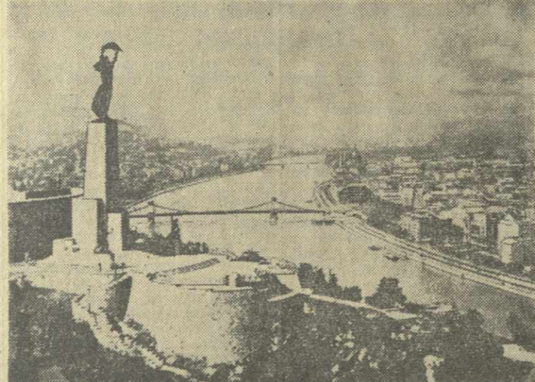
Венгерская Народная Республика. На снимке: общий вид Будапешта.

Что касается командования вооруженными силами ООН, на глазах которого Чомбе развязывает в Конго гражданскую войну, то оно остается верным себе. Представитель власти ООН в Элизабетвиле сообщил вчера, что у него «очень мало данных о том, что происходит в Маноно».