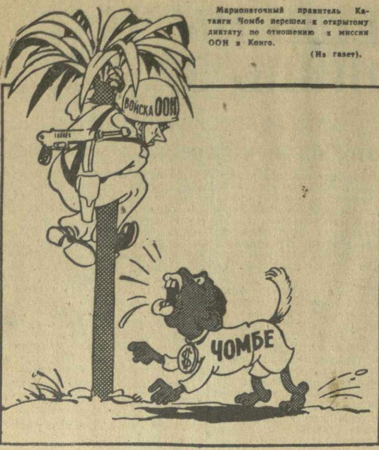
НА ВЫСОТЕ ПОЛОЖЕНИЯ. Рис. А. Канделаки.

Марionеточный правитель Катанги Чомбе перешел к открытому диктату по отношению к миссии ООН в Конго. (Из газет).