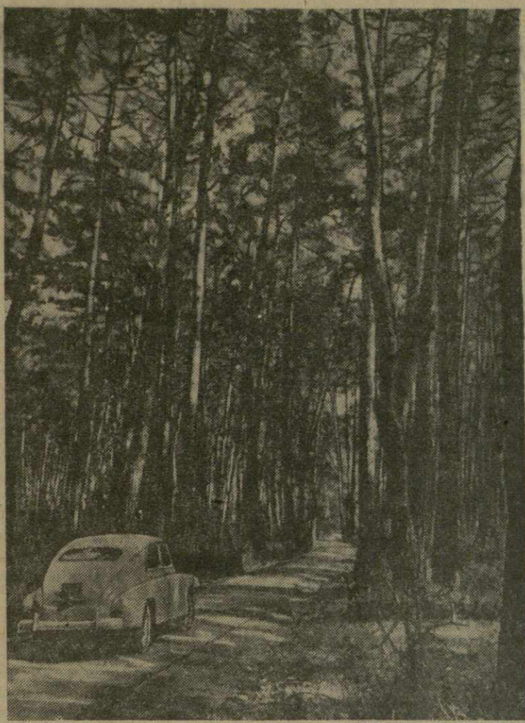
На снимке: пицундская роща реликтовых сосен.