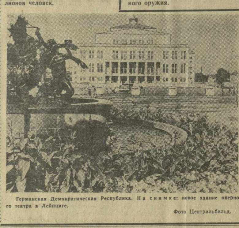
Германская Демократическая Республика. На снимке: новое здание оперного театра в Лейпциге.

Д. Кабалевского. Но подлинного мастера оркестр достигает в исполнении свадебного марша из оперы Р. Вагнера «Лоэнгрин», в увертюре и опере Дж. Верди «Навуходносор», а также концерта для саксофона Крестона. И все же, при всем своем разнообразии, программа первого концерта не совсем удовлетворяет. Это замечание в первую очередь относится к маршам — браурным, несколько официальным, а также к финалу соль-минорной симфонии Калининграда, прозвучавшей бледно, маловыразительно. Кроме того, было бы желательно, чтобы оркестр познакомил нас и с другими произведениями американских композиторов. Тбилисские любители музыки тепло встретили зарубежных гостей. Гастроль Филармонического духового оркестра Мичиганского университета в СССР расширяет и укрепляет культурное сотрудничество наших народов.