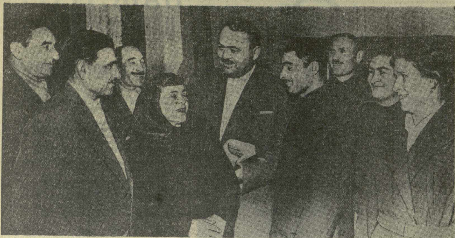
На снимке: группа делегатов XVII цителцарской районной партийной конференции.