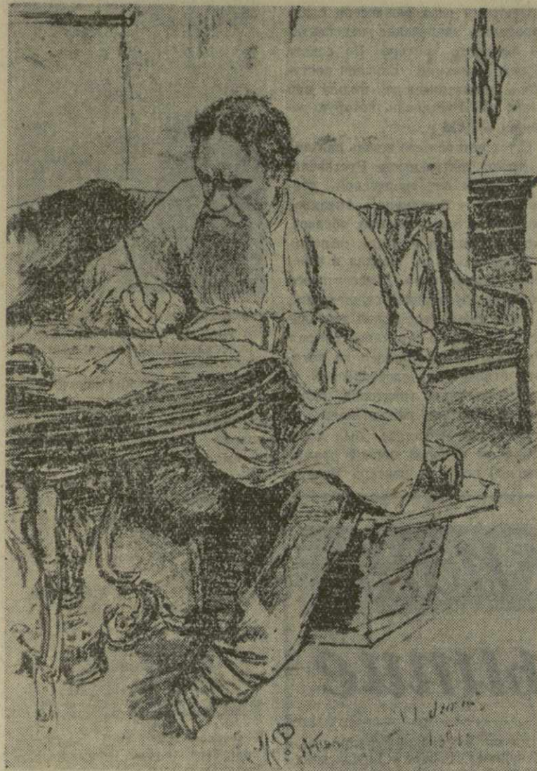
Лев Николаевич Толстой за работой. Рисунок И. Е. Репина.

„Л. Толстой сумел поставить в своих работах столько великих вопросов, сумел подняться до такой художественной силы, что его произведения заняли одно из первых мест в мировой художественной литературе“. В. И. ЛЕНИН.