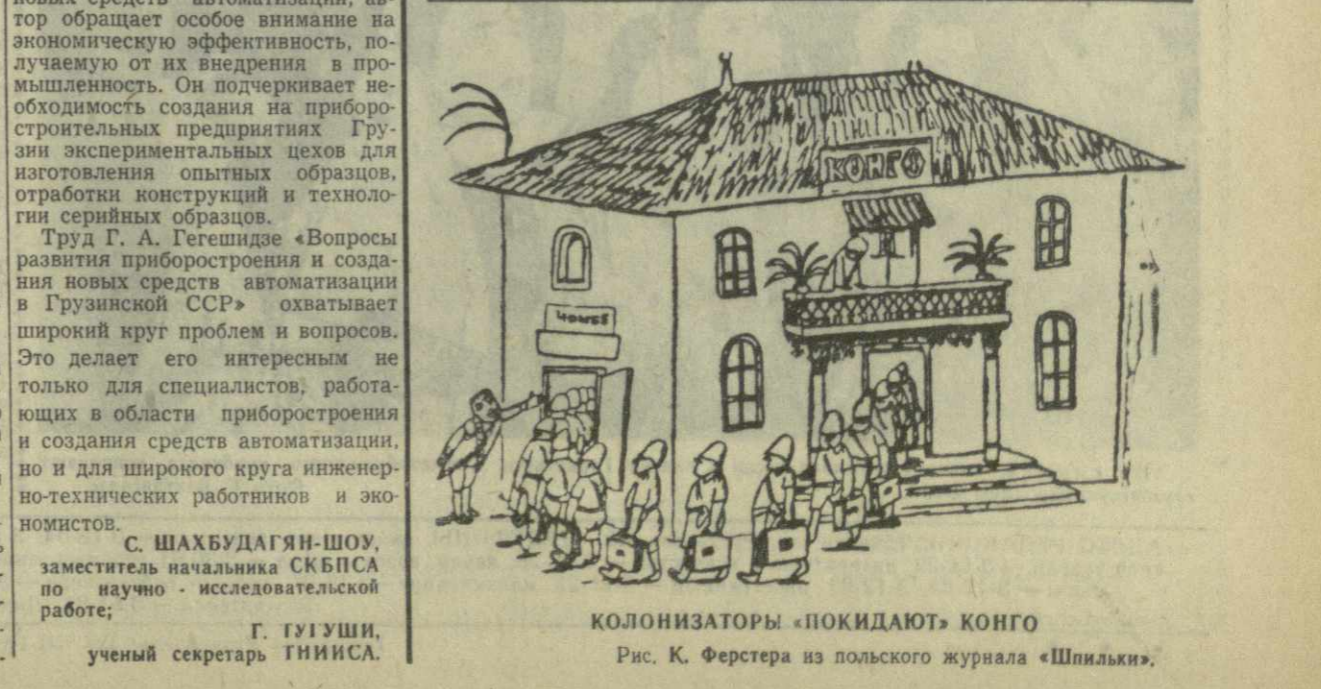
Рис. К. Ферстера из польского журнала «Шпильки».

ПАРИЖ, 22 ноября. (ТАСС). По сообщению корреспондента агентства Франс Пресс из Леопольдвилья, вчера по распоряжению Мобуту около 300 конголезских солдат при поддержке бронемашин окружили посольство Ганы. Тунисские солдаты численностью до роты, входящие в контингент войск ООН и охраняющие посольство Ганы, заняли боевые позиции в парке посольства, где находились также ганские полицейские. Генеральный комиссар внутренних дел Нусбаумер заявил вчера, что если повеления в делах Ганы откажутся покинуть пределы Конго, то солдатам Мобуту «придется вторгнуться в посольство». НЬЮ-ЙОРК, 22 ноября. (ТАСС). По сообщению агентства Ассошиэйтед Пресс, вчера вечером мбутовские солдаты напали на войска ООН, охраняющие посольство Ганы. ЛОНДОН, 22 ноября. (ТАСС). Как сообщает корреспондент агентства Рейтер из Леопольдвилья, между солдатами Мобуту и тунисскими войсками, охраняющими ганское посольство, началась ожесточенная перестрелка.