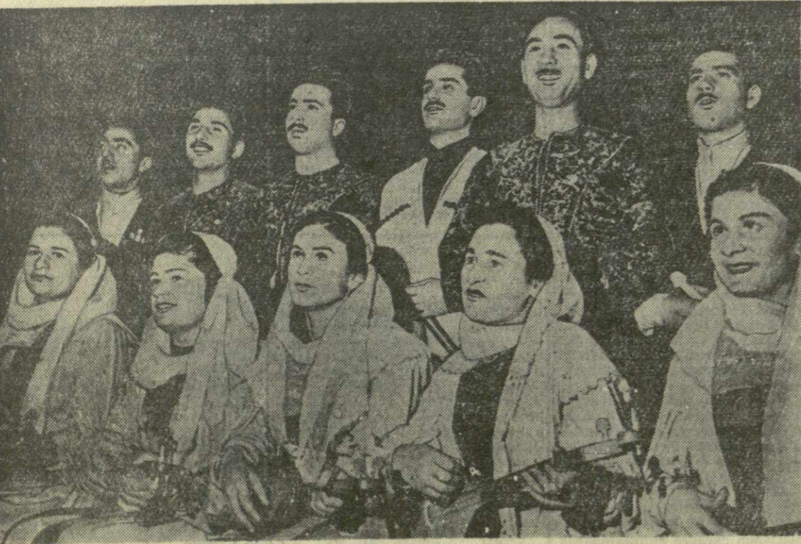
На снимке: солисты ансамбля песни и пляски Горьковского хлопчатобумажного комбината исполняют грузинскую народную песню.

В итоге четырехдневных состязаний первое место заняли борцы РСФСР. На втором месте спортсмены Украины. Прогресс борцам Белоруссии и РСФСР, несмотря на сегодняшние победы, отнюдь не команду Грузии на третье место. Филиновская — Канабадзе 1. f4 e5 2. b3 d5 3. Cb2 Cf5 4. e3 Kf6 5. Kf3 h6 6. Cb5+ Kf1—d7 7. C:d7 K:d7 8. d3 e6 9. Fe2 Cg4 10. Kb—d2 Fe7 11. g3 0—0 12. 0—0 16 13. h3 Ch5 14. g4 Cf7 15. h4 Cd6 16. Ld—g1 e5 17. f5 Fa5 18. Kpb1 h5 19. e4 be 20. de e4 21. Ke1 Ce5 22. e2 C:d5 23. Kc4 C:e4 24. Fe:c4 C:b2 25. Kp:b2 Ke51 26. Fe6+ Kpb2 27. b4 cb 28. Ke2 Ld2 29. Ld1 Fa3+ 30. Kpb1 L:e2 31. Kp:c2 Fe3+ 32. Kpb1 Kc4 белые сдались. К. ГОГИВА.