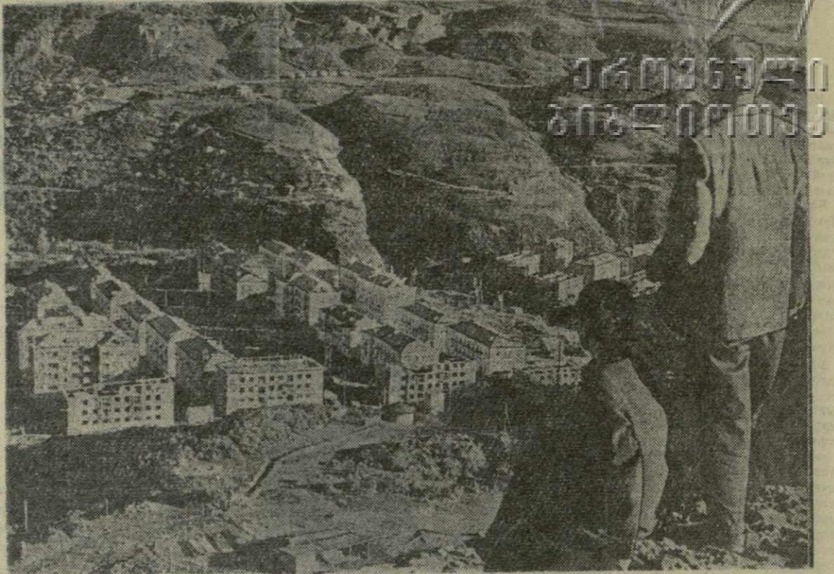
Члнатура. С каждым годом растет и хорошеет город грузинского марганца. На снимке: вид на рабочий поселок горняков — Нагуги.