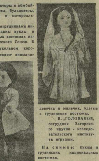
Девочка и мальчик, одетые в грузинские костюмы. В. ГОЛОВАНОВ, сотрудник Загорского научно-исследовательского института игрушек.

На малых белых чересклях и одетая наверх черная палаша. Рядом с ними — девочка в грузинском национальном платье. Кажется, что вот-вот зазвучит дождь, и эта пара пустится в пляс... Но мы не на смотре художественной самодеятельности школьников. Мы в Загорском научно-исследовательском институте игрушек. Подмосковный город Загорск издавна известен производством игрушек. Художники-скульпторы, конструкторы и мастера-ученики научно-исследовательского института ежегодно создают до 150 новых различных образцов игрушек. Сказочный вид имеет демонстрационный зал института. Каких только не встретишь тут игрушек: легкие и грузовые авто-